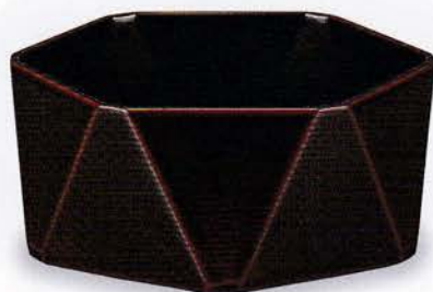
Y61-2 鉢 ダイヤ型 溜内黒 ¥16,000(税別) (12.8×12.8×5.7)1個 漆 [化粧] 国産 [合板]