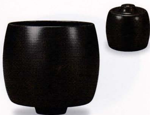
Y61-3 背高鉢 SINAFU black ¥18,000(税別) (φ14.0×13.0)1個 漆 [化粧] 国産