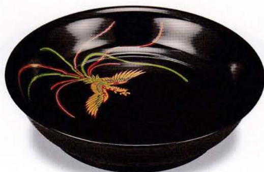
Y61-4 8.0 鉢 黒 鳳凰 ¥20,000(税別) (φ23.7×5.6)1個 漆 [化粧] 国産