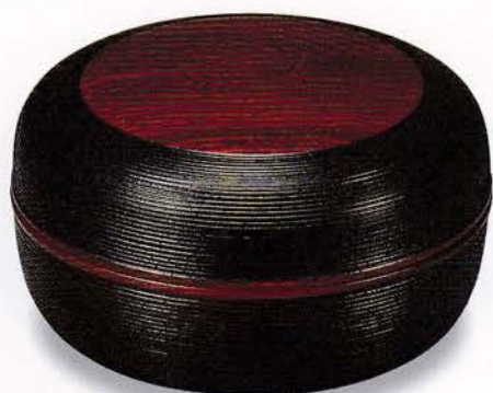
Y61-7 6.0 菓子器 玉洩塗分 ¥12,000(税別) (φ18.0×9.8)1個 漆 [化粧] 国産