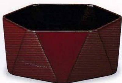
Y61-1 鉢 ダイヤ型 古代朱内黒 ¥16,000(税別) (12.8×12.8×5.7)1個 漆 [化粧] 国産 [合板]