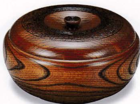
Y61-6 6.0 菓子器 樺 純木 ¥12,000(税別) (φ17.5×9.5)1個 漆 [化粧] 国産