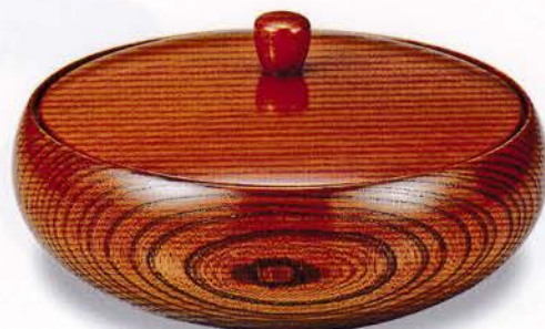
Y61-8 7.0 菓子器 樺 平安 ¥20,000(税別) (φ20.8×10.7)1個 漆 [化粧] 国産 [木箱]