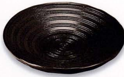
Y49-5 4.2 茶托 亀甲 黒拭漆 ¥6,500 (税別) (φ12.5×2.3)5枚 漆 [ポー] [中国]