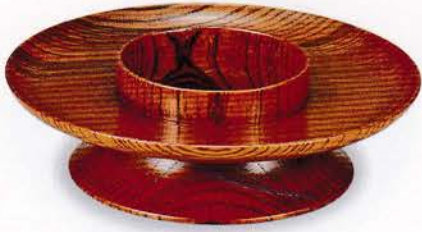
Y49-1 4.2 茶台 樺 拭漆 ¥6,000 (税別) (φ12.6×3.8)1個 漆 [化粧] [国産]