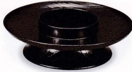
Y49-2 4.2 茶台 樺 黒 ¥6,000 (税別) (φ12.6×3.8)1個 漆 [化粧] [国産]