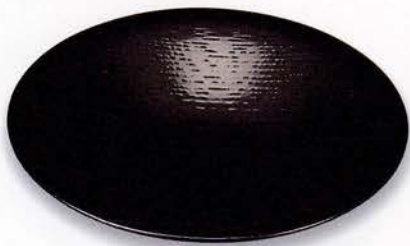
Y49-12 4.0 茶托 栓 反型 黒 ¥9,000 (税別) (φ12.0×2.0)5枚 漆 [化粧] [国産]