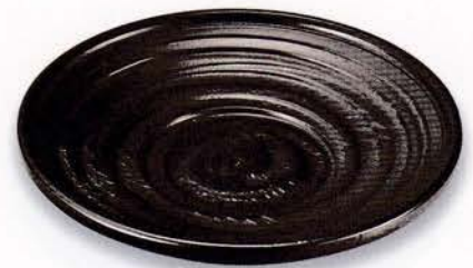
Y49-9 3.5 茶托 象谷 ¥9,000 (税別) (φ10.5×2.0) 5枚 Y49-10 4.0 茶托 象谷 ¥10,000 (税別) (φ12.2×2.0) 5枚 Y49-11 4.5 茶托 象谷 ¥11,000 (税別) (φ13.5×2.0) 5枚 漆 [化粧] [国産]