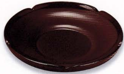
Y49-3 4.0 茶托 梅型 木地呂 ¥6,000 (税別) (φ12.0×2.0)5枚 漆 [化粧] [中国]