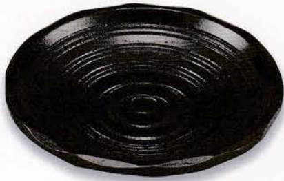
Y49-4 4.2 茶托 測ダイヤ 黒スリ ¥6,000 (税別) (φ12.6×2.5)5枚 漆 [化粧] [中国]