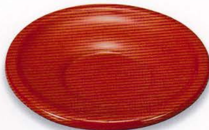
Y49-8 4.0 茶托 緑丸 洗朱 ¥7,000 (税別) (φ12.2×2.0)5枚 漆 [化粧] [輸加]