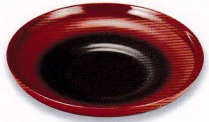
Y49-6 4.0 茶托 だるま型 ぼかし塗 ¥6,500 (税別) (φ12.0×2.0)5枚 漆 [化粧] [輸加]