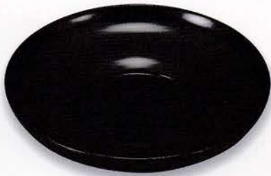
Y49-7 3.5 茶托 だるま 黒 ¥7,000 (税別) (φ10.2×2.0)5枚 漆 [化粧] [輸加]