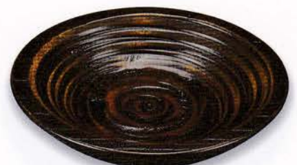
Y49-14 4.0 茶托 柄 象谷 拭漆 ¥10,000 (税別) (φ12.2×2.0) 5枚 Y49-15 4.5 茶托 柄 象谷 拭漆 ¥11,000 (税別) (φ13.5×2.0) 5枚 漆 [化粧] [国産]