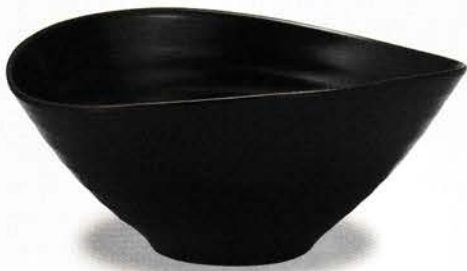
Y136-5 7.0 和らぎ鉢 溜 ¥4,500 (税別) (18.0×21.0×8.5) 1個