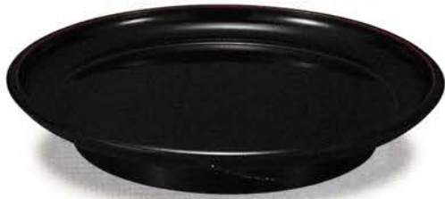
Y136-1 盛皿 溜塗 ¥3,500 (税別) (φ16.3×3.4)1枚 漆 [化粧] [国産] 木質