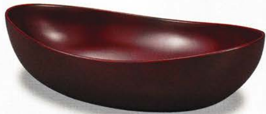
Y136-4 貴船鉢 古代朱 ¥4,500 (税別) (24.3×15.5×7.3)1個 漆 [ポール] [国産] 木質