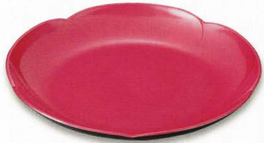
Y136-2 8.0 梅鉢 パールピンク ¥3,800 (税別) (φ24.0×2.8)1個 漆 [ポール] [国産] 樹脂