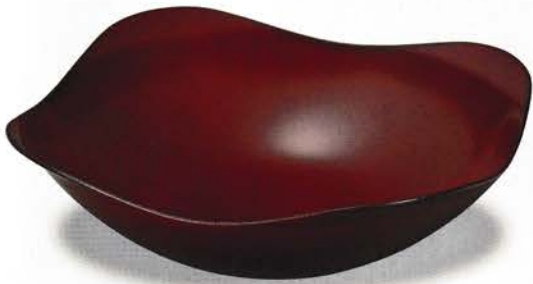
Y136-3 8.0 風雅鉢 銀朱 ¥4,200 (税別) (23.8×23.8×7.4)1個 漆 [化粧] [国産] 木質