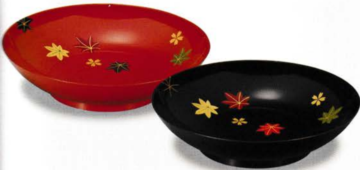
Y136-8 7.7 盛鉢 春秋づくし 洗朱塗 ¥7,500 (税別) (φ23.2×5.7) 1個