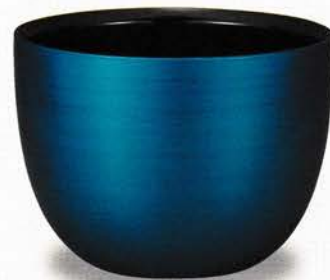
Y136-10 ワインクーラー パール青 ¥14,500 (税別) (φ21.0×15.0)1個 漆 [化粧] [国産] 樹脂