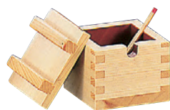
檜・マス型薬味入(小) 19-085-21(19202) 2,480円 約6.1×6.1×H6.2cm ※薬味スプーン付