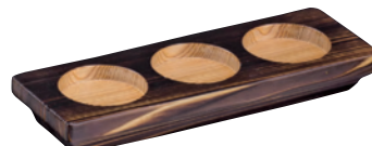
焼杉長角薬味皿 19-085-18(19207) 1,650円 約20×6.8×H3cm / 穴約φ5cm