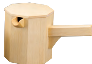
木曾ひのぎ湯筒 EX polymer EX ポリマー塗装 19-085-14(18184) 20,500円 身約10.4×10.4×H11.3cm / 柄約L10cm ※容量:約450ml ※EXポリマー塗装 > P18参照