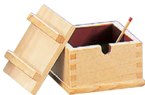
檜・マス型薬味入(大) 19-085-20(19201) 3,980円 約8.3×8.3×H7cm ※薬味スプーン付