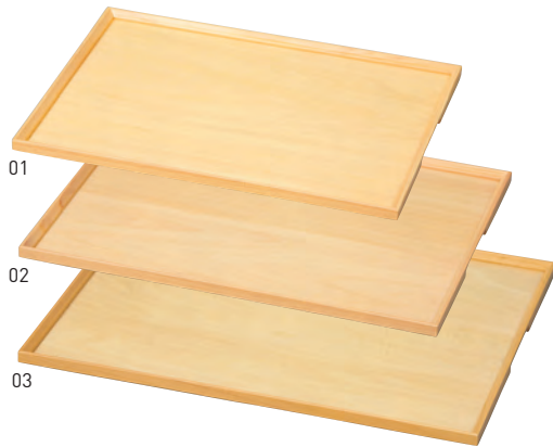
白木長角トレイ 薄型