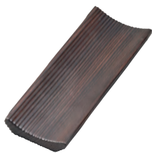
焼杉・スリムおしぼり受け