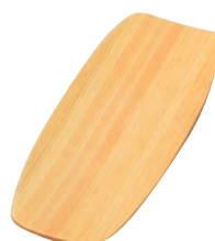
ひのきオシボリ皿(舟型)