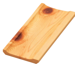
ひのき紅節オシボリ皿