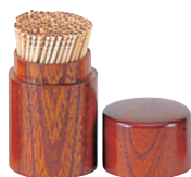
けやき・蓋付楊枝立