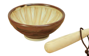
ごますりくん(ひのきすりごぎ付)

19-406-25 (16102) 680円 約φ3×L22cm / 容量約10ml