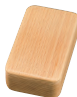
長手楊枝箱 クリアー

19-406-10 (16395) 2,100円 約9.5×6×H3cm / 内寸約8.5×5×H1.8cm