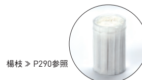
楊枝 > P290参照

19-406-11 (15117) 1,650円 約9.9×6.6×H3cm / 内寸約8.7×5.4×H2cm