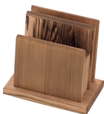
焼杉メニューナブキン立

19-405-12(16336) 5,700円 約27×12×H8cm / 上部内寸約25.8×8.4cm