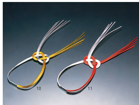
あわじ金銀水引(10ヶ入)

19-307-09(25818) 3,300円 約φ10cm (1ヶ当り330円) ※陶器別売