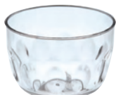
樹脂カップ バカラ

19-252-01(32471) 90円 約φ5.9×H3.6cm ※PS(ポリスチレン)