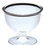
樹脂カップ プチワイン

19-252-02(32472) 40円 約φ5.5×H3.6cm ※PS(ポリスチレン)