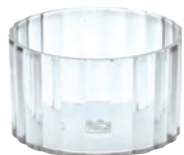
樹脂カップ クリスタル

19-252-01(32471) 90円 約φ5.9×H3.6cm ※PS(ポリスチレン)