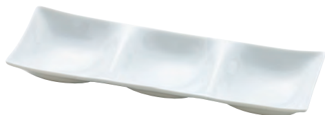
白磁・凧 三つ仕切り

19-231-02(32264) 1,250円 約25.8×8.5×H2.9cm