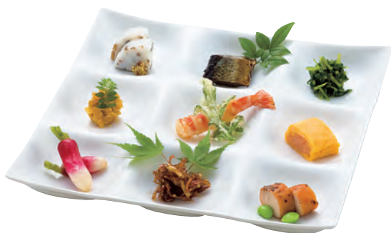
白磁・凧 九つ仕切り

19-231-03(32265) 1,450円 約17.1×17.1×H2.9cm