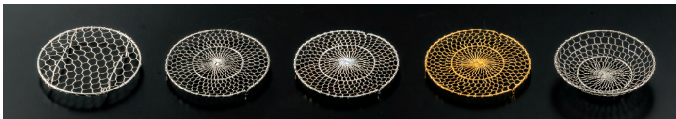
ステンレス目皿 4寸

※天然素材の為直径や形状には大きくバラツキがございます。丸太の輪切りの特性として若干の割れや反りの可能性もございます。