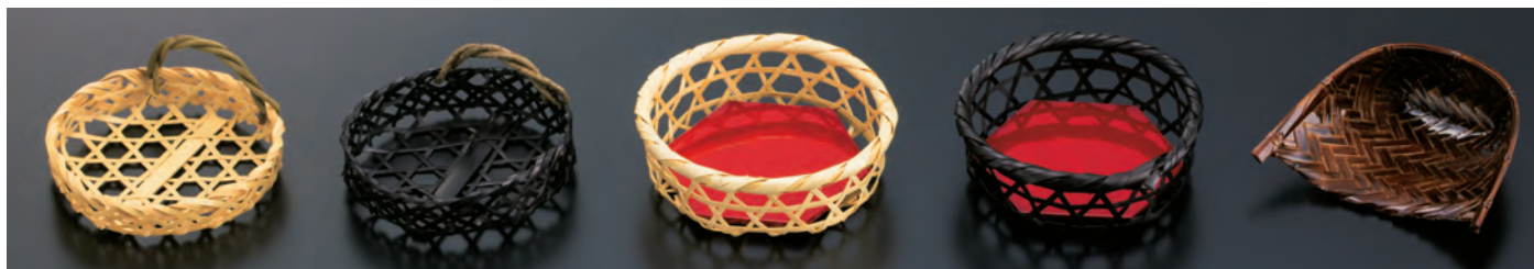
六ツ目かざら付籠

【中子 標準サイズ】 1樹内寸が11.6×11.6cm以上のものにお使いいただけます。