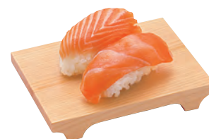
東濃檜・盛皿ミニ

19-208-06 (30351) 1,250円 約12×9×H2cm ※すべり止め加工はしてありません。