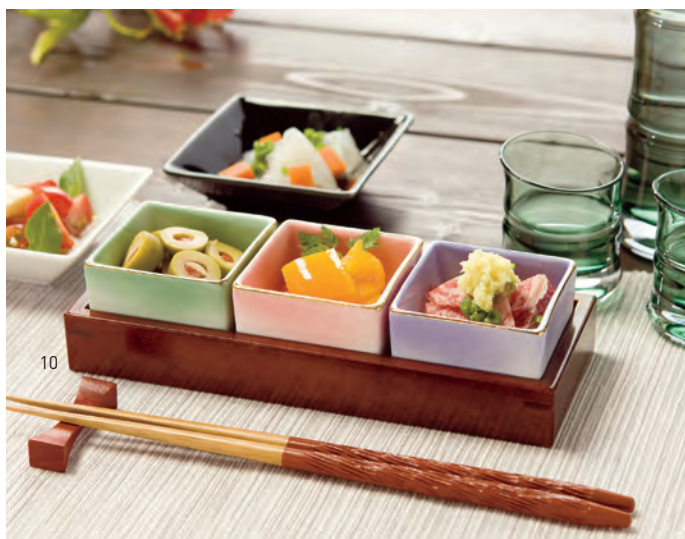
陶器角型珍味入用カスター台

19-182-10 (16180) 1,650円 約18.8×7×H2.5cm / 内寸約17.5×5.8×H1.8cm