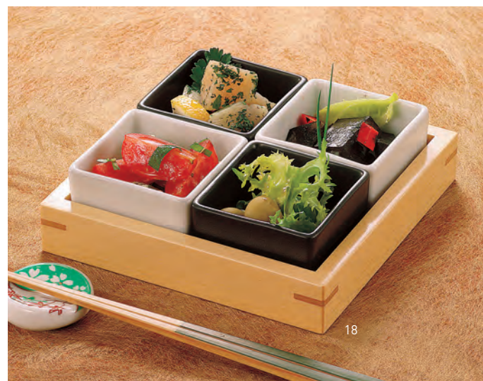
白木市松専用トレイ

19-182-18 (27001) 1,500円 約14.3×14.3×H2.7cm / 内寸約12.6×12.6×H2cm