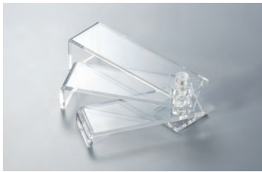
アクリル立体盛付台

19-177-01(30157) 4,500円 収納時約18×5×H5.6cm 上段 約18×5×H5cm / 中段 約16×5×H3.5cm / 下段 約14×5×H2cm