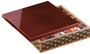
細密盛器用 春慶印籠蓋

19-121-01 (28004) 5,500円 約21×21×H1.8cm ※蓋のみ ※裏木曾春慶塗