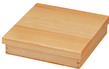
檜・ミニ松花堂弁当