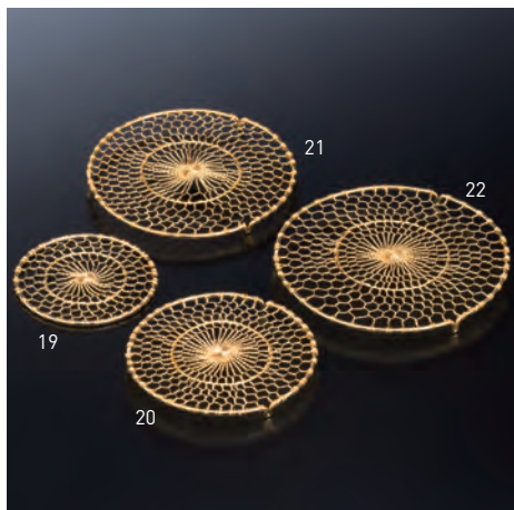
金州(ゴールド仕上)