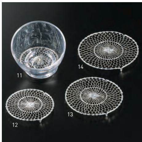
ステンレス手編み目皿