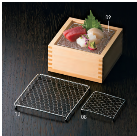
ステンレス目皿 角型