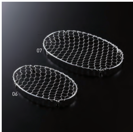
ステンレス小判目皿