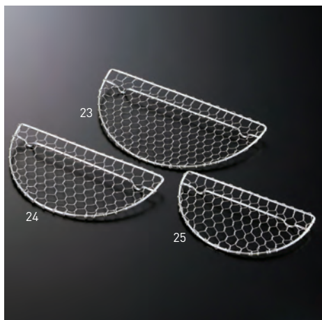
とんかつ用金網 半月(足付)