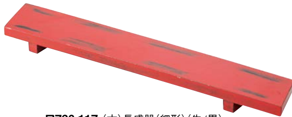
7736-117 (木)長盛器(細形)(朱/黒) 53×9×3.5cm(中国) 8,350円