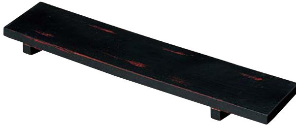
7736-087 (木)長盛器(黒/朱) 55×13×3.5cm(中国) 6,000円