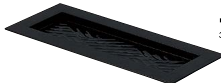
7736-207 (P)布漕盛台 33×13.5×2cm 1,450円