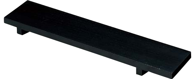
7736-097 (木)長盛器(黒) 55×13×3.5cm(中国) 6,000円 7736-107 (木)長盛器(細形)(黒) 53×9×3.5cm(中国) 5,500円