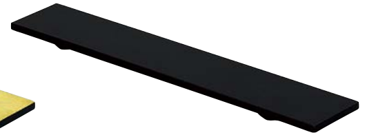
7736-187 長角黒盛器(細長形) 45×8×1.9cm(中国) 5,000円 7736-197 長角黒盛器(細短形) 35×7×1.5cm(中国) 3,650円