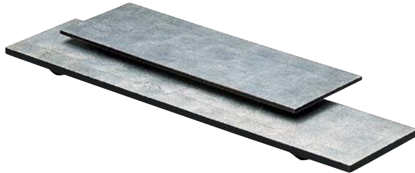
7736-047 長角銀盛器(大) 50×12×2cm(ベトナム) 7,000円 7736-057 長角銀盛器(小) 35×12×2cm(ベトナム) 6,000円