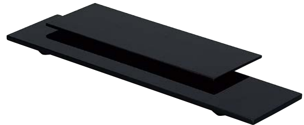
7736-127 長角黒盛器(大) 50×12×H2cm(ベトナム) 6,000円 7736-137 長角黒盛器(小) 35×12×H2cm(ベトナム) 4,200円