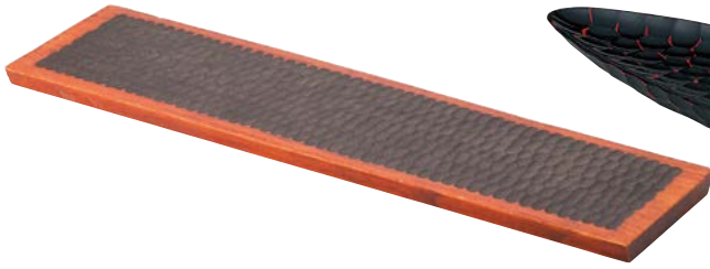
7736-017 (木)長盛器(茶漕) 50×13×2cm(中国) 9,200円