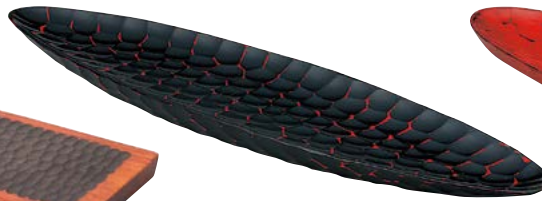
7736-027 亀甲曙舟型盛皿 55×13×H3cm(中国) 7,000円