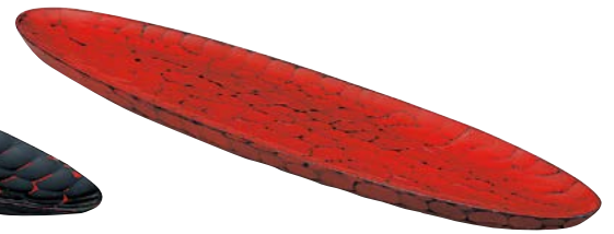
7736-037 亀甲根来舟型盛皿 55×13×H3cm(中国) 7,000円