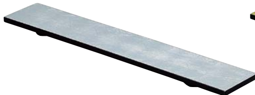
7736-147 長角銀盛器(細長形) 45×8×1.9cm(ベトナム) 5,800円 7736-157 長角銀盛器(細短形) 35×7×1.5cm(ベトナム) 4,400円