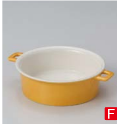
イ599-027 イエロークルールスープレシチュー 19×15×5cm (40入・陶) 1,500円