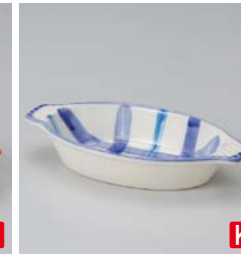
ホ599-227 ブルーチェックグラタン 21×11×3.8cm (60入・陶) 1,150円