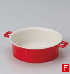
イ599-017 赤クルールスープレシチュー 19×15×5cm (40入・陶) 1,600円