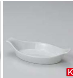
ホ599-337 白磁舟グラタン 21×10.5×4.2cm (60入・磁) 770円