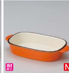
イ599-047 オレンジ長方形グラタン 21×10.7×4cm (40入・陶) 1,600円