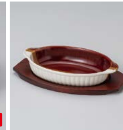
ス599-297 掛分小判グラタン 21.3×13×4cm (50入・陶) (萬古焼) 900円 ス599-307 小判グラタン敷台NO.3 24×14.5×1.2cm (内寸17×11.5cm) (120入) (白磁彩ア) 2,000円