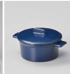
カ599-357 ネイビーココットS φ10×13×4.5cm (30入・陶) 1,800円