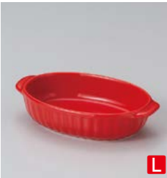
カ599-317 レッド両手楕円グラタン 18×11×4cm (40入・磁) 900円