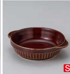
カ599-097 アメ丸グラタン 18.5×15.5×4.5cm (40入・磁) 1,150円