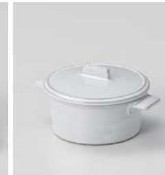
カ599-367 ホワイトココットS φ10×13×4.5cm (30入・陶) 1,800円