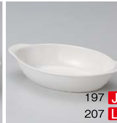
イ599-197 ホワイトオーバルグラタン 大 23.2×13.7×5.1cm (5×8入・磁) (マレーシア) 2,000円 イ599-207 ホワイトオーバルグラタン 小 21.2×12.5×4.7cm (5×8入・磁) (マレーシア) 1,600円