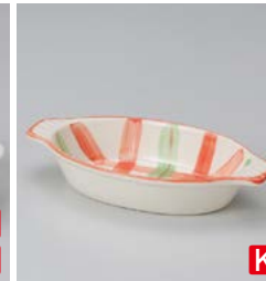
ホ599-217 ピンクチェックグラタン 21×11×3.8cm (60入・陶) 1,150円