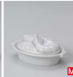
カ599-347 エビグラタン 15.2×9.7×7.3cm (60入・磁) 1,500円