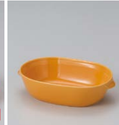
ホ599-057 オレンジ玉子グラタン 16×10.4×4.1cm (60入・磁) 750円