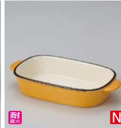
イ599-037 イエロー長方形グラタン 21×10.7×4cm (40入・陶) 1,600円