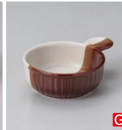
ス599-277 掛分片手グラタン 18×φ13.5×5.5cm (40入・陶) (萬古焼) 920円