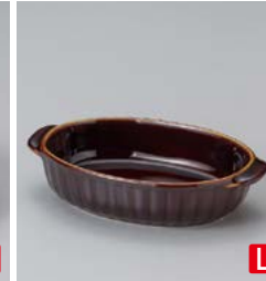
カ599-117 アメ袖両手楕円グラタン 18×11×4cm (40入・磁) 800円