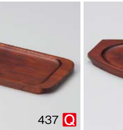
ワ599-447 木受台角型 (内寸長) R 22.3×11.5×H1.5cm 内寸18×9.8cm (中国) 1,100円