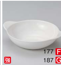
イ599-177 軽量強化HWラウンドグラタン(大) 22.2×18.2×5.5cm (5×8入・磁) (マレーシア) 1,800円 イ599-187 軽量強化HWラウンドグラタン(小) 17.5×14.1×4.5cm (5×8入・磁) (マレーシア) 1,350円