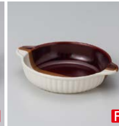
ス599-287 掛分丸グラタン 20.3×φ16.5×4cm (50入・陶) (萬古焼) 900円