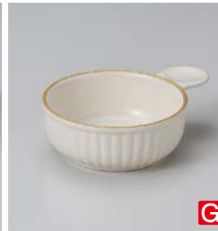
ス599-267 セミストーン片手グラタン 17.5×φ13×4.2cm (40入・陶) (萬古焼) 920円