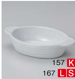
カ599-157 白グラタンL 21×13×4.5cm (40入・磁) 1,300円 カ599-167 白グラタンM 17.5×11×4.5cm (50入・磁) 1,050円