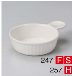
ス599-247 乳白片手サラダ 19×φ14×4.5cm (50入・陶) (萬古焼) 1,000円 ス599-257 乳白片手スープ 16×φ12×4cm (60入・陶) (萬古焼) 850円