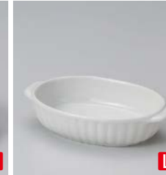
カ599-127 ホワイト両手楕円グラタン 18×11×4cm (40入・磁) 800円