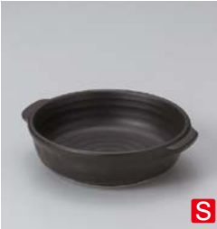
ホ599-077 黒耐熱グラタン 17.2×14.8×4.5cm (60入・陶) 990円