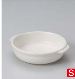
ホ599-087 白耐熱グラタン 17.2×14.8×4.5cm (60入・陶) 990円