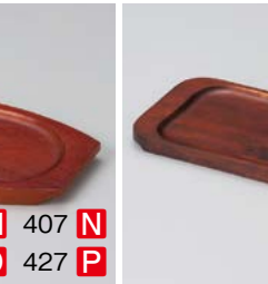
ワ599-437 木受台長角 Q 22×11.5×H1.2cm 内寸17.7×10cm (中国) 1,100円