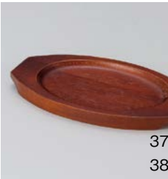
ワ599-377 スリ塗舟型木台X (160×110) K 22×13×H1.5cm 1,950円 ワ599-387 スリ塗舟型木台Y-2 (145×95) L 19×12×H1.5cm 1,750円