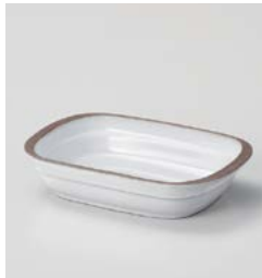
カ599-327 ホワイトグリルシェフグラタン 18.4×12.2×3.8cm (40入・磁) 1,300円