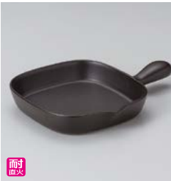
ス599-237 ブラックセラムフィッシュパン 27.5×19×4cm (20入・陶) (萬古焼) 2,600円