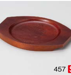
ワ599-467 スリ塗丸木台Lφ140 T 22×17×H1.5cm 2,200円