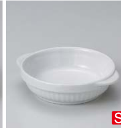
カ599-107 ホワイト丸グラタン 18.5×15.5×4.5cm (40入・磁) 1,150円