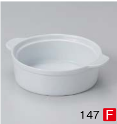
ハ599-137 ルナホワイト19cmスタックグラタン 19×15.8×5.2cm (40入・磁) (中国) 2,100円 ハ599-147 ルナホワイト16.5cmスタックグラタン 16.5×13.8×5cm (48入・磁) (中国) 1,740円