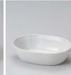
ア599-067 ホワイトオーバルグラタン 16×10.5×4cm (60入・磁) 680円