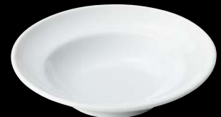
ヤ564-137 N9吋スープ φ24.2×4.2cm (50入) 680円