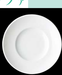
ヤ564-017 W6.5吋パン皿 φ17.3×2.3cm (120入) 360円