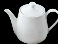
ヤ564-317 ポットL 800cc (40入) 3,600円