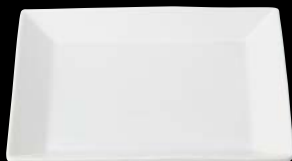
ヤ564-347 23cm角皿 22.7×2.6cm (50入) 1,800円