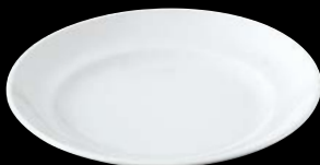
ヤ564-067 N9.5吋ミート φ24.6×3.3cm (50入) 680円