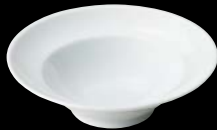
ヤ564-157 Nオートミル φ17×5cm (90入) 420円