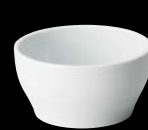
ヤ564-187 12cmフリーボール φ11.7×6.1cm (80入) 380円