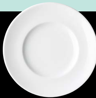
ヤ564-037 W9.5吋ミート φ24.6×3.3cm (50入) 680円