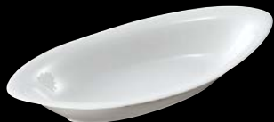
ヤ564-287 セロリ皿L 36.3×16×5.2cm (20入) 1,700円