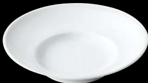
ヤ564-107 W9吋スープ φ24.2×4.6cm (50入) 730円