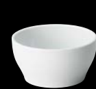
ヤ564-197 11cmフリーボール φ10.6×5.9cm (120入) 350円