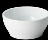
ヤ564-177 13cmフリーボール φ13.2×6.3cm (60入) 530円