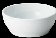
ヤ564-167 16cmフリーボール φ15.8×6.4cm (50入) 730円