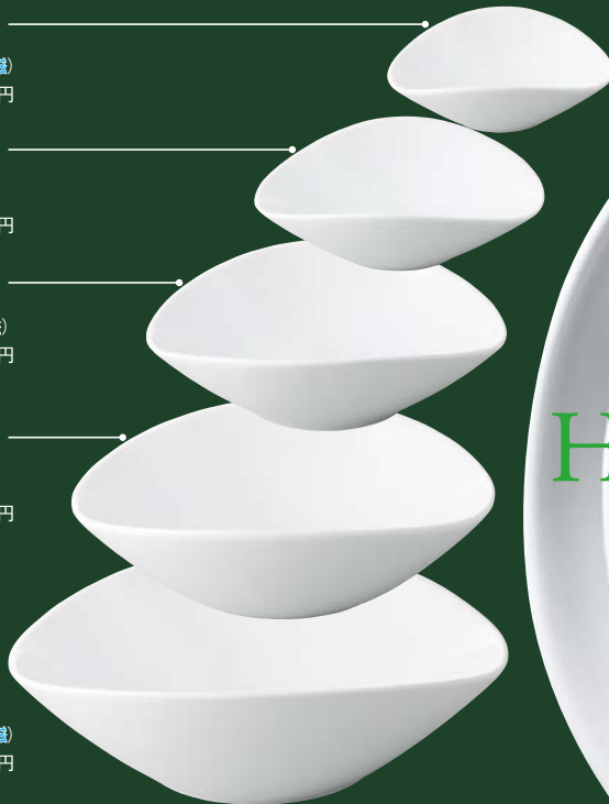
キ496-167 アーバン 白楕円鉢 (LL) 29.8×27.8×9.2cm (2×4入・磁) (中国) 4,000円