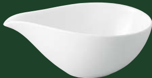
キ496-057 アーバン 片口鉢 (L) 18.3×11.2×6.8cm (5×6入・磁) (中国) 1,150円