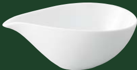
キ496-067 アーバン 白片口鉢 M 16.3×10.2×6.2cm (5×6入・磁) (中国) 930円