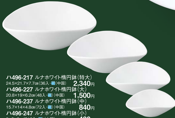
ハ496-217 ルナホワイト楕円鉢 (特大) 24.5×21.7×7.7cm (36入・磁) (中国) 2,340円 ハ496-227 ルナホワイト楕円鉢 (大) 20.8×19×6.2cm (48入・磁) (中国) 1,500円 ハ496-237 ルナホワイト楕円鉢 (中) 15.7×14×4.8cm (72入・磁) (中国) 840円 ハ496-247 ルナホワイト楕円鉢 (小) 9×8×3cm (216入・磁) (中国) 430円