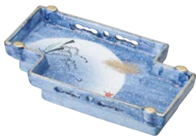
ミ474-027 京橋 焼物皿 23.2×13×4.6cm (30入・磁) 4,850円