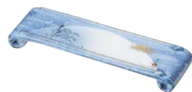
ミ474-047 手巻 前菜皿 22×6.5×2.2cm (50入・磁) 2,850円