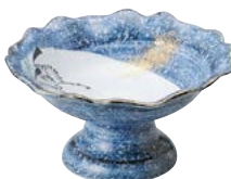
ミ474-087 高台 刺身鉢 φ15.5×8cm (40入・磁) 3,450円