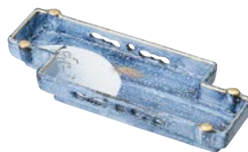
ミ474-037 京橋 突出皿 24.3×9.5×3.5cm (40入・磁) 3,380円