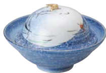
ミ474-147 丸蓋向 φ15.2×8.8cm (30入・磁) 4,050円