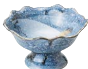
ミ474-077 高台 小鉢 φ12.7×7cm (60入・磁) 2,850円