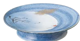
ミ474-117 丸高台 天皿 φ19.3×4.2cm (20入・磁) 4,350円