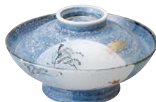
ミ474-137 平蓋向 φ16.4×9.3cm (30入・磁) 3,700円