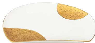
ツ474-547 半月天皿 23.7×17.5×3cm (30入・磁) 3,850円