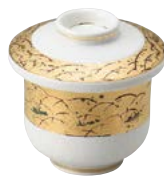
ツ474-587 新型むし碗 φ8.4×9.1cm (40入・磁) 3,250円