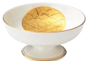
ツ474-517 丸高台刺身鉢 φ15.5×7.8cm (30入・磁) 3,850円