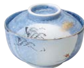
ミ474-157 円菓子碗 φ12×8.3cm (40入・磁) 3,450円