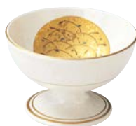
ツ474-537 丸高台小鉢 φ11×7.5cm (50入・磁) 3,200円