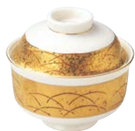
ツ474-567 菓子碗(小) φ10.5×9.3cm (40入・磁) 3,850円