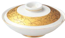
ツ474-577 新平蓋向(小) φ15.5×7.5cm (30入・磁) 3,850円