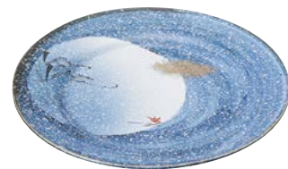
ミ474-177 アラカルト皿 φ26.5×3cm (20入・磁) 4,350円