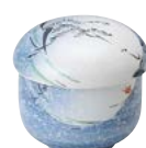
ミ474-167 むし碗 φ9.3×8.6cm (60入・磁) 2,980円