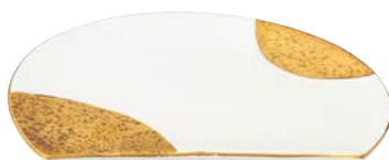
ツ474-617 半月焼物皿 21.5×15×2.7cm (40入・磁) 2,650円