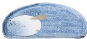
ミ474-057 半月皿 23.5×16×2.5cm (30入・磁) 3,850円