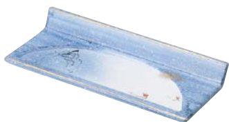
ミ474-017 片上り 突出皿 24×9.7×3cm (40入・磁) 2,850円