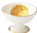
ツ474-527 丸高台千代口 φ8×4.8cm (80入・磁) 1,650円