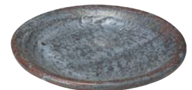
ト473-587 和皿 φ14.5×2cm (50入・陶) 3,300円