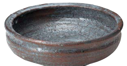
ト473-627 盛鉢大単 φ24×7.5cm (5入・陶) 20,000円