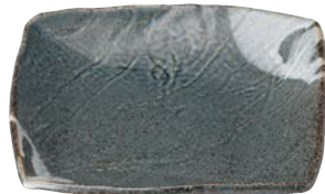
タ473-177 スクエア大皿 24×23.7×3.3cm (10入・陶) 2,500円