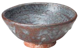
ト473-597 飯碗 φ12.5×6cm (40入・陶) 4,200円