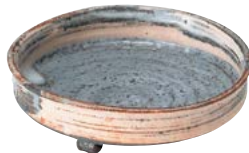
ト473-527 単志の向付 φ14×4.5cm (20入・陶) 4,800円