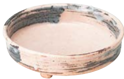
ト473-517 ピンク志の向付 φ14×4.5cm (20入・陶) 4,800円