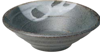
タ473-067 富士型7.0鉢 23.5×22.5×7cm (20入・陶) 2,500円