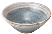
ト473-557 単筋入豆鉢 φ10.5×4cm (40入・陶) 1,150円