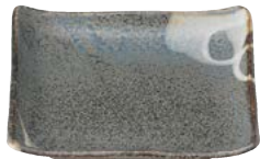
タ473-167 正角皿 18×18×3.5cm (30入・陶) 1,200円