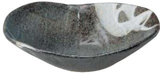
タ473-057 楕円多用鉢 22.2×17.5×6.5cm (20入・陶) 2,000円