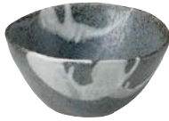
タ473-117 たたら大鉢 13.4×13×6.7cm (40入・陶) 1,200円