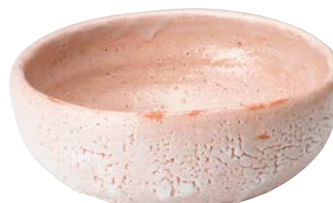
ト473-617 盛鉢中ピンク φ20×9cm (5入・陶) 9,000円