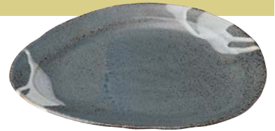
タ473-047 リム大皿 29.8×24.7×2.7cm (20入・陶) 2,500円