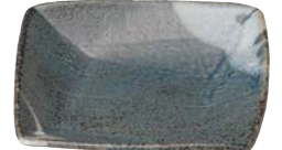
タ473-157 スクエア中皿 19×18.5×3.3cm (20入・陶) 1,400円