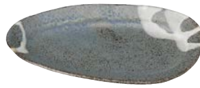
タ473-127 リム中皿 23.4×15.5×2cm (30入・陶) 1,100円