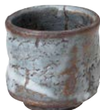
ト473-607 湯呑 φ8×8cm (40入・陶) 3,800円