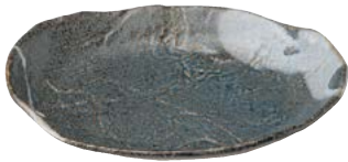
タ473-017 パーティ皿 25×18.5×3.5cm (30入・陶) 1,800円