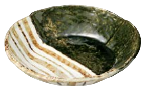
□463-017 7.5丸鉢 φ23×4.5cm(30入・陶) 3,240円