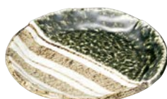
□463-197 6.0丸皿 φ18.3×2.3cm(80入・陶) 1,240円