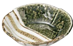
□463-027 6.5丸鉢 φ19×4.5cm(40入・陶) 2,420円