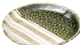
□463-207 7.0丸皿 φ21.5×2cm(50入・陶) 1,860円