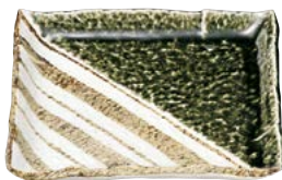
□463-097 正角8.0皿 21.6×21.6×2.5cm(40入・陶) 3,190円