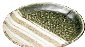
□463-217 9.0丸皿 φ28.5×2.4cm(30入・陶) 3,960円