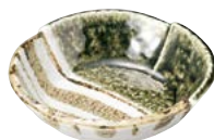
□463-047 5.0刺身鉢 φ15×3.8cm(80入・陶) 1,470円