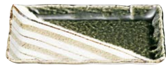
□463-117 9.0長角皿 26.5×15.9×2.5cm(40入・陶) 2,370円