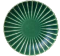
タ422-047 12.5cm丸皿 φ12.6×2cm (100入・磁) 550円