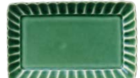
タ422-097 17cm長角皿 17×10.8×2.2cm (60入・磁) 1,700円