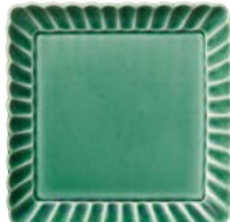
タ422-077 13.5cm正角皿 13.5×13.5×2cm (60入・磁) 1,300円