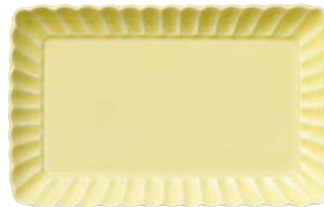
タ422-587 21cm長角皿 21.5×13.5×3cm (30入・磁) 2,000円