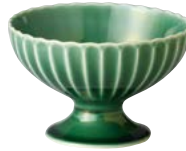
タ422-147 高台デザート碗 φ12×7.7cm (60入・磁) 2,400円