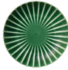
タ422-037 14.5cm丸皿 φ14.5×2.3cm (80入・磁) 850円