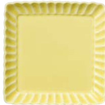
タ422-577 13.5cm正角皿 13.6×13.6×2cm (60入・磁) 1,300円