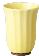
タ422-667 フリーカップ φ8×10.8cm (270cc) (60入・磁) 1,000円