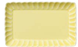
タ422-597 17cm長角皿 16.8×10.7×2.3cm (60入・磁) 1,700円