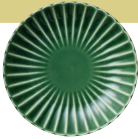
タ422-017 18cm丸皿 φ18.5×2.8cm (40入・磁) 1,000円