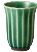
タ422-167 フリーカップ φ8×10.7cm (270cc) (60入・磁) 1,000円