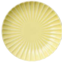
タ422-527 16.5cm丸皿 φ16.5×2.5cm (60入・磁) 900円