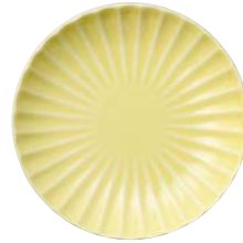
タ422-537 14.5cm丸皿 φ14.5×2.3cm (80入・磁) 850円