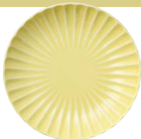
タ422-517 18cm丸皿 φ18.5×2.8cm (40入・磁) 1,000円