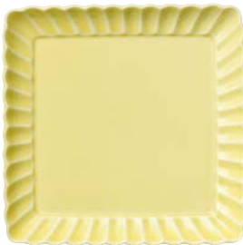
タ422-557 17cm正角皿 18×17.8×2.6cm (30入・磁) 2,000円