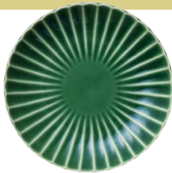
タ422-027 16.5cm丸皿 φ16.5×2.5cm (60入・磁) 900円