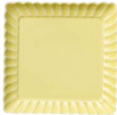
タ422-567 15.5cm正角皿 15.7×15.6×2.3cm (40入・磁) 1,700円