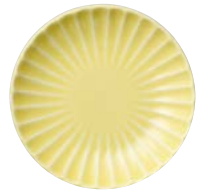
タ422-547 12.5cm丸皿 φ12.6×2cm (100入・磁) 550円