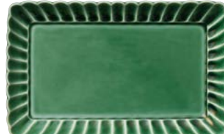
タ422-087 21cm長角皿 21.5×13.5×3cm (30入・磁) 2,000円