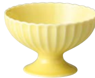
タ422-647 高台デザート碗 φ12×7.7cm (60入・磁) 2,400円