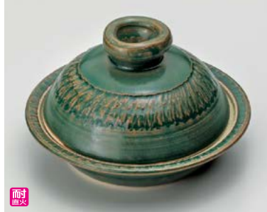
ス406-217 織部(手造り)5号陶板 φ16.5×9.5cm(身3.5cm)(16入・陶)(萬古焼) 6,000円