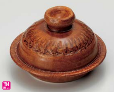
ス406-227 アメ釉(手造り)5号陶板 φ16.5×9.5cm(身3.5cm)(16入・陶)(萬古焼) 6,000円