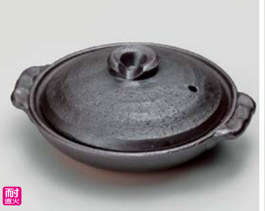
ス406-237 鉄釉5号陶板 18.5×φ15.5×7cm(身3.5cm)(30入・陶)(萬古焼) 2,900円