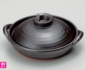
ス406-247 鉄釉6号陶板 22.5×φ18.5×8cm(身4.2cm)(16入・陶)(萬古焼) 3,500円