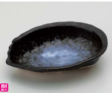
ス406-197 アワビ型陶板(大) 21×15×5cm(350cc)(30入・陶)(萬古焼) 1,500円 ス406-207 アワビ型陶板(小) 18×14×4cm(300cc)(40入・陶)(萬古焼) 1,200円