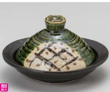
ト406-307 織部格子楕円鍋 18.5×17×11cm(9入・陶) 4,100円