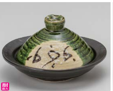
ス406-297 耐熱絵織部蓋付陶板鍋 18.5×17×11cm(20入・陶) 3,900円