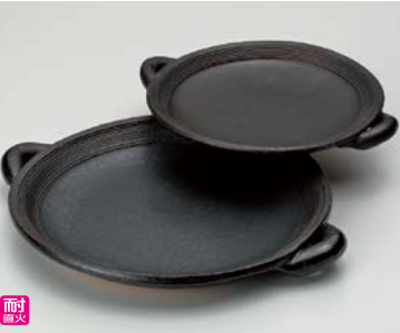
ス406-077 黒陶樹目8号陶板 28.5×φ24×4.2cm(20入・陶)(萬古焼) 3,500円 ス406-087 黒陶樹目7号陶板 26×φ21×4cm(30入・陶)(萬古焼) 2,800円 ス406-097 黒陶樹目6号陶板 22.5×φ18.5×3.5cm(40入・陶)(萬古焼) 2,200円