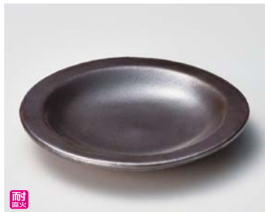
ス406-147 鉄結晶耐熱皿 φ16.5×2.5cm(50入・陶)(萬古焼)(手造り) 1,700円