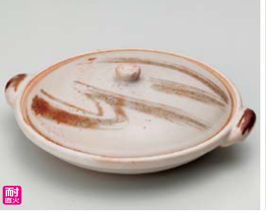
ス406-127 志野刷毛絵柳川陶板 18.8×φ16.5×6.5cm(身3.3cm)(30入・陶)(萬古焼) 3,800円