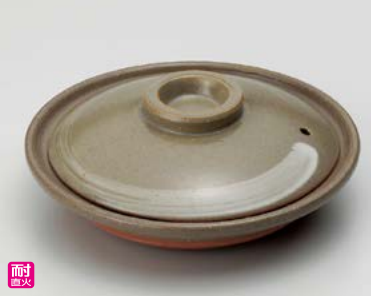
ス406-117 京風白刷毛目柳川鍋 φ17×6.5cm(身3.7cm)(30入・陶)(萬古焼) 3,100円