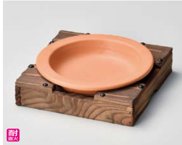
ス406-017 茶 柳川皿(小) φ16.6×2.9cm(50入・陶)(萬古焼) 1,700円 ス406-027 柳川用釜台(小) 17.3×17.3×3.5cm(40入) 1,350円