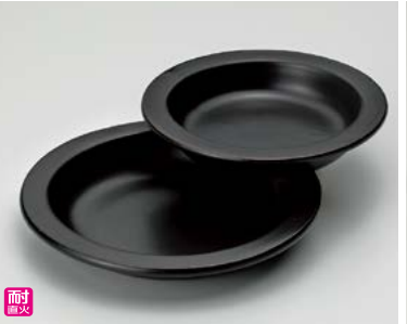
ス406-057 黒柳川皿(大) φ19.5×2.9cm(40入・陶)(萬古焼) 1,800円 ス406-067 黒柳川皿(小) φ16.5×2.8cm(50入・陶)(萬古焼) 1,700円