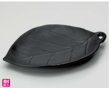
ス406-157 黒釉葉型陶板(大) 27×19×2.5cm(40入・陶)(萬古焼) 2,000円 ス406-167 黒釉葉型陶板(小) 23.5×16.5×2cm(50入・陶)(萬古焼) 1,300円