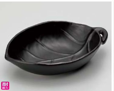
ス406-177 黒釉葉型鍋(大) 21×14.3×5cm(450cc)(40入・陶)(萬古焼) 1,750円 ス406-187 黒釉葉型鍋(小) 17×12.3×5cm(300cc)(60入・陶)(萬古焼) 1,050円