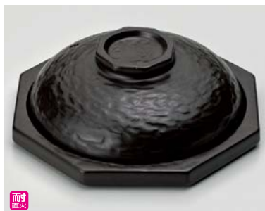
ス406-257 黒釉溶岩風陶板6号 20×20×7cm(16入・陶)(萬古焼) 3,300円