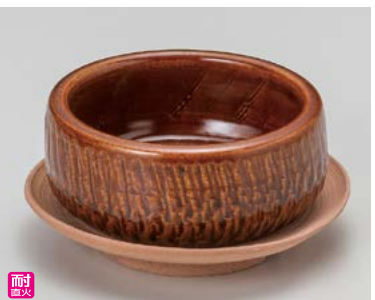
ス406-277 アメ釉4.5号はも鍋 φ14×5.8cm(500cc)(30入・陶)(萬古焼) 3,000円 ス406-287 はも鍋用受け皿 φ16×2.5cm(50入・陶)(萬古焼) 1,400円