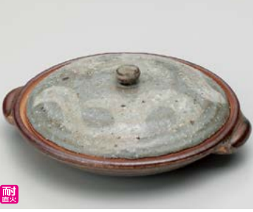
ス406-137 砂付緑釉柳川陶板 18.8×φ16.5×6.5cm(身3.3cm)(30入・陶)(萬古焼) 3,800円