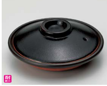
ス406-107 天目柳川鍋 φ17×6.5cm(身3.7cm)(30入・陶)(萬古焼) 3,100円