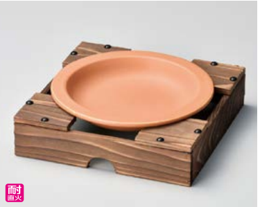
ス406-037 茶 柳川皿(大) φ20×2.8cm(40入・陶)(萬古焼) 1,800円 ス406-047 柳川用釜台(大) 22×22×5cm(30入) 2,000円