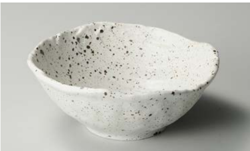
フ244-127 白斑点荒ソギ23cm大鉢 24.5×23.5×9.2cm (24入・磁)