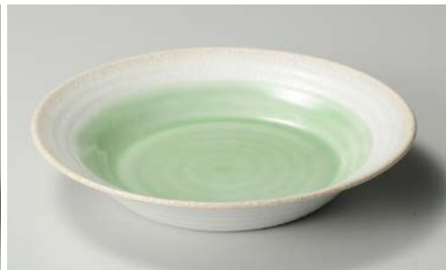
ハ244-167 若葉8.5鉢 φ26.3×4.8cm (24入・磁)