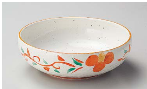
ミ244-017 唐草花8.0ボール φ25.5×8cm (20入・磁)