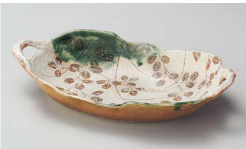
ア244-027 織部萩両手付尺一盛鉢 34.5×20×6cm (14入・陶)