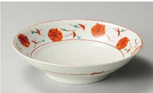
ア244-157 錦草花盛鉢 φ25×6.4cm (20入・磁)