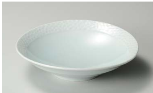
ホ244-107 青白磁ネオ8.0鉢 φ25.5×6cm (26入・磁)