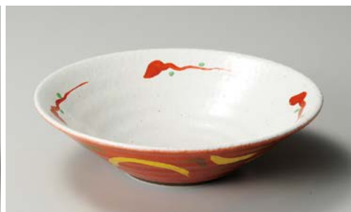
ミ244-067 朱巻武蔵野リップル8.5鉢 26.3×7.3cm (30入・磁)