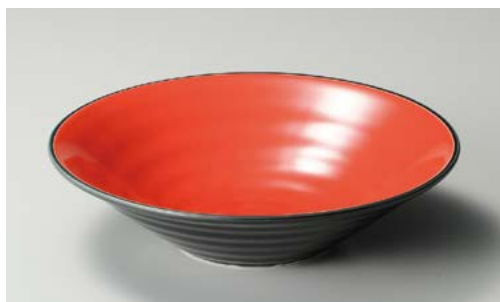
ハ244-047 朱天目8.0鉢 φ26.2×7cm (30入・磁)