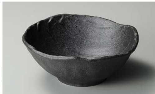
フ244-137 鉄ペーパー荒ソギ23cm大鉢 24.5×23.5×9.2cm (24入・磁)