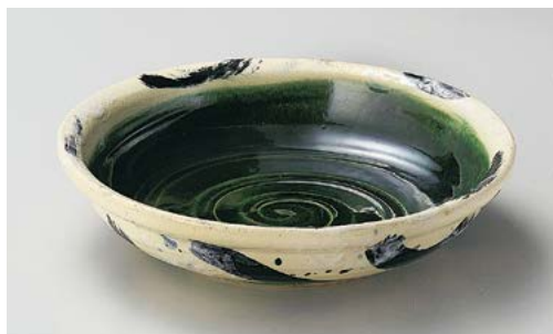
ト244-077 織部呉須刷毛目8.5寸平鉢 φ26×6.4cm (12入・磁)