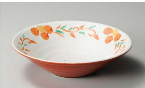
ミ244-057 朱巻唐草花リップル8.5鉢 26.3×7.3cm (30入・磁)