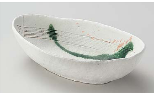
カ244-087 白クシメ楕円大鉢 29×15×8.2cm (20入・陶)