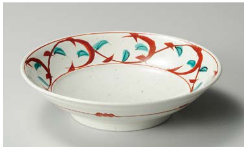
ア244-147 錦唐草盛鉢 φ25×6.4cm (20入・磁)