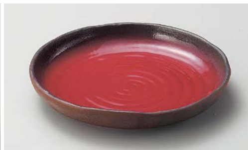
口244-097 ぬくもり丸10.0浅鉢 φ26.4×4.2cm (15入・磁)