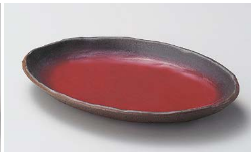
口244-037 ぬくもり小判型10.0鉢 29.8×20.6×4.5cm (15入・磁)