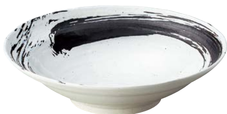
7236-067 白玉粉引内黒刷毛尺鉢 φ31×8.2cm(12入・磁) 6,100円