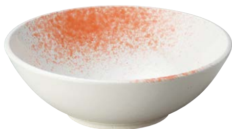
7236-037 白玉粉引ピンク吹尺盛鉢(ビュッフェスタイル) φ29.7×10cm(8入・磁) 7,300円