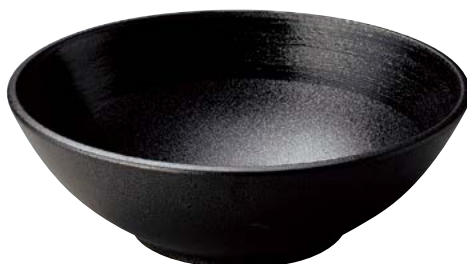
7236-047 黒御影内黒刷毛尺盛鉢(ビュッフェスタイル) φ29.7×10cm(8入・磁) 7,300円