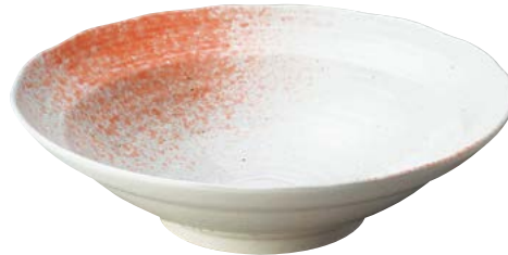
7236-087 白玉粉引ピンク吹尺鉢 φ31×8.2cm(12入・磁) 6,100円