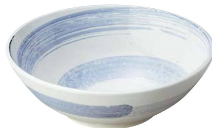
7236-017 白玉粉引青刷毛渦尺盛鉢(ビュッフェスタイル) φ29.7×10cm(8入・磁) 7,300円