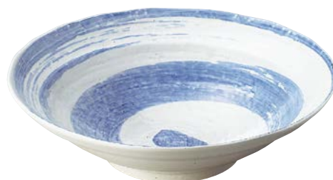
7236-057 白玉粉引青刷毛渦尺鉢 φ31×8.2cm(12入・磁) 6,100円