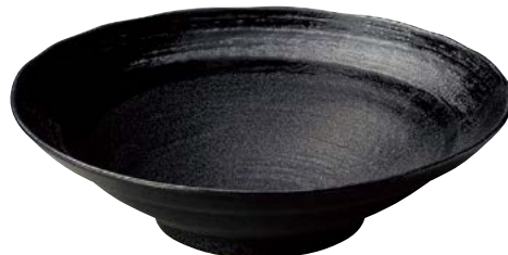
7236-077 黒御影内黒刷毛尺鉢 φ31×8.2cm(12入・磁) 6,100円