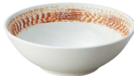
7236-027 白樺尺盛鉢(ビュッフェスタイル) φ29.7×10cm(8入・磁) 7,300円