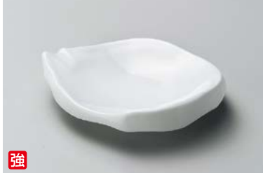
カ212-067 強化白釉ちぎり4.5寸皿 13.8×11.5×3.4cm (40入・強) 1,300円