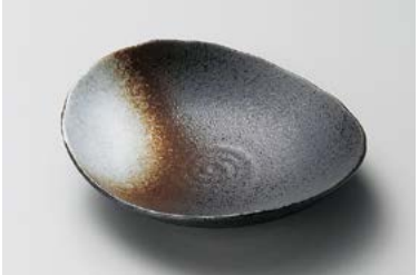
タ212-087 白吹天目ダ円皿大 17.3×15×4.3cm (60入・磁) 800円