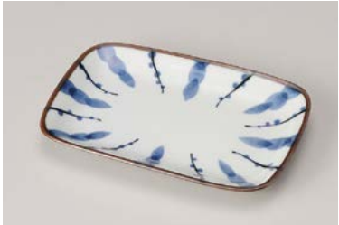
ヤ212-237 太細十草銘々皿 16.4×10.8×2cm (80入・磁) 430円