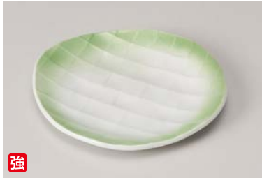
口212-027 ヒワ吹格子 フルーツ皿 16.3×15.1×1.8cm (60入・強) 1,450円