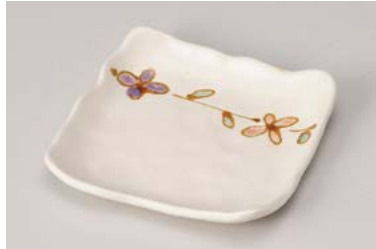
ト212-217 花結角皿 12.1×11.5×2.2cm (80入・陶) 520円