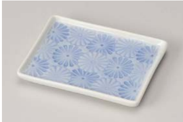
口212-227 菊紋 長角銘々皿 14.2×10.8×2cm (100入・磁) 580円