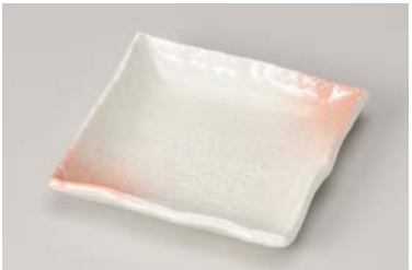
ト212-127 桜吹クシ目 取皿 14×13.5×2.5cm (50入・磁) 760円