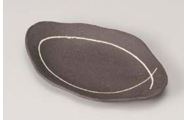
ミ212-057 黒土白ライン変形皿 17.8×11.5×2.5cm (100入・陶) 1,390円