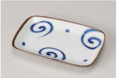
ヤ212-247 うず銘々皿 16.4×10.8×2cm (80入・磁) 430円