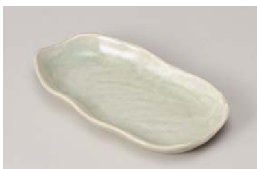
口212-147 うすみどり 6寸変型串皿 18×9.6×2.5cm (80入・磁) 750円