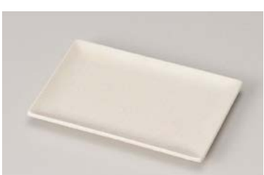
ホ212-197 粉引長角銘々皿 16×10.7×1.4cm (80入・磁) 620円