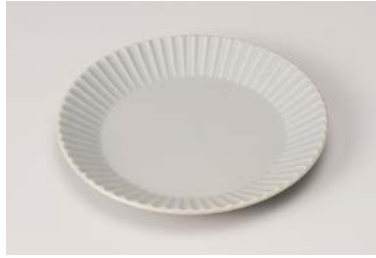
カ212-017 サラストライププレート φ19×1.9cm (50入・陶) 1,980円

突出皿 長角皿 さんま皿 焼物皿 仕切皿 細長皿 長角大皿 変形大皿 丸大皿 角大皿 角中皿 楕円皿 変形中皿 丸中皿 フルーツ皿・銘々皿・取皿 和皿 小皿 萬古焼大皿 大鉢 盛鉢 ボール 焼酎サーバー ロックカップ フリーカップ 酒器 箸置 卓上小物 そば小物・薬味皿 鉢皿(仅タラガイ) 多用丼 小丼 そば丼・飯丼・蓋丼 飯器・飯碗 寿司湯呑 湯呑 煎茶・玉湯呑 抹茶碗 ポット・急須・土瓶 備前焼 有田焼・波佐見焼 土器・土瓶・土鍋・割物 すり鉢