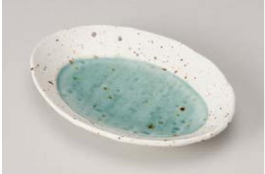
ホ212-077 湖水&月光17cmだえん皿 16.7×11.8×2.5cm (80入・磁) 980円