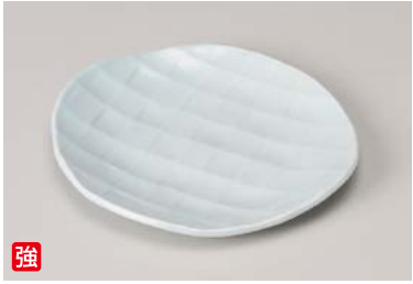
口212-037 青磁 フルーツ皿 16.3×15.1×1.8cm (60入・強) 1,410円