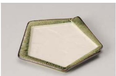
ホ212-157 織部瀬十草五角皿(小) 14.5×14×1.4cm (80入・磁) 770円