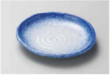
ア212-047 吹墨変形6.0皿 17×15.5×2.7cm (60入・磁) 1,150円