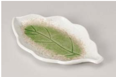
イ212-107 ヒワ吹 木の葉 銘々皿 19×11×1.7cm (100入・磁) 800円