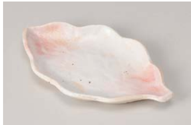
イ212-097 桜志野木の葉 銘々皿 19×11×1.7cm (100入・磁) 800円