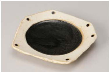
ツ212-117 和黒(わっこく) ちぎり取皿 16.5×15×2.5cm (80入・陶) 720円