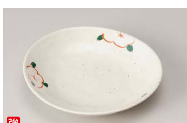
口212-177 雪粉引赤絵花5.0楕円深皿 16.7×16×3.5cm (80入・強) 640円