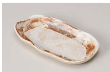
口212-137 志野 6寸変型串皿 18×9.6×2.5cm (80入・磁) 750円