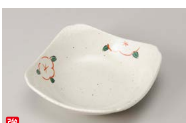
口212-187 雪粉引赤絵花5.0角皿 14×14×4cm (80入・強) 670円