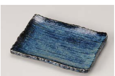
ハ212-207 藍瀬厚四角千筋取り皿 16.5×11.8cm (80入・磁) 580円