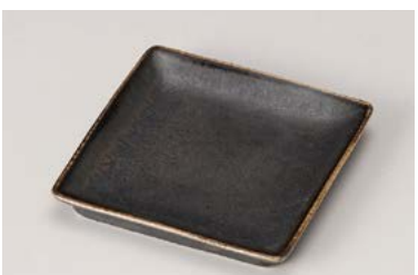
カ212-167 仙窯変黒S 10.3×10.3×1.7cm (80入・磁) 680円