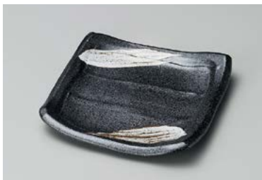
イ211-097 栗色刷毛目淵厚銘々皿 14.9×13.8×2.5cm (80入・磁) 880円