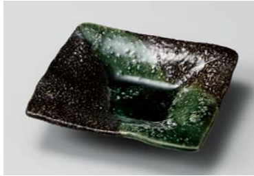
タ211-027 天の川華前菜皿 16×15×3.5cm (40入・陶) 1,200円