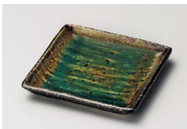
ア211-217 深海12cm四角皿 12×12×1.7cm (100入・陶) 600円