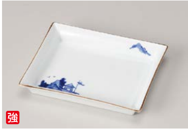
ウ211-017 淵鍔山水長角皿 15×12×2.2cm (60入・強) (美濃焼) 2,550円