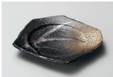
タ211-147 金彩すすきざり取皿 16.3×15×2.5cm (60入・磁) 680円