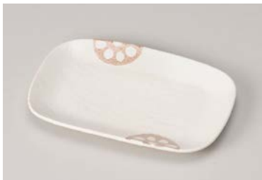
ヤ211-137 れんこん白 長角皿 17.4×11.6×1.7cm (80入) 730円