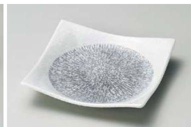
ホ211-247 しぼり薄墨十草正角4.5皿 13.5×13.5cm (60入・磁) 460円