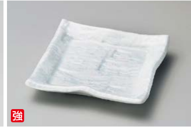
カ211-047 スーパー青白磁石目銘々皿 12.5×12.5×2.5cm (80入・強) 1,450円