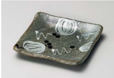
口211-057 山帰来正角銘々皿 13.5×13.5×2.5cm (100入・陶) 1,460円