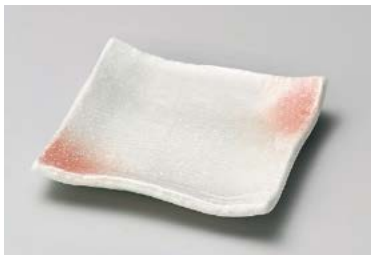
イ211-177 桃山ふぶき正角皿 10.5×10.5×2cm (100入・磁) 620円