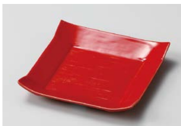
ハ211-227 パレット12cmプレート(赤) 12×12×2cm (100入・磁) 580円