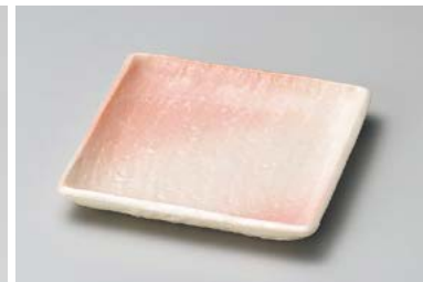
ヨ211-207 さくら志野角小皿 11.5×11.5cm (5×20入) 580円