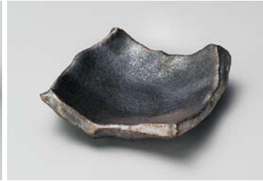
カ211-037 銀サビ黒ちぎり角皿(小) φ13×13×3.8cm (50入・磁) 2,180円