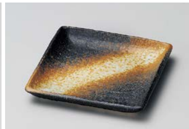
ヨ211-197 火だすき角小皿 11.5×11.5cm (5×20入・陶) 580円