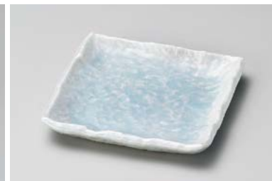
ロ211-127 青白釉正角銘々皿 12.3×12.3×2.1cm (100入・磁) 770円