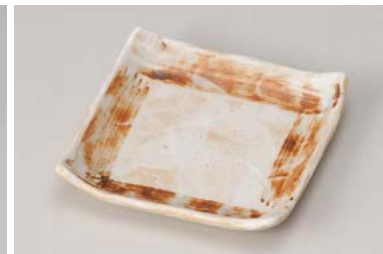
ロ211-167 志野 4寸正角皿 12.8×12.8×2.5cm (80入・磁) 750円