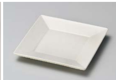
イ211-117 練色スクエア4.5角皿 13.5×13.5×1.5cm (80入・磁) 900円