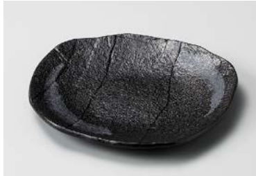
ミ211-067 黒銀河フルーツ皿 17×15.5×2cm (100入・磁) 1,080円