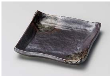
イ211-187 鉄黒銘々皿 12.5×12.5×1.5cm (80入・磁) 640円