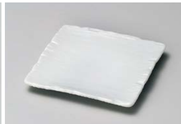
イ211-157 弥生千筋白正角皿 12×12×1.3cm (80入・磁) 730円