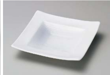
ア211-077 白磁縞織正角皿小 15×15×2.9cm (60入・磁) 1,000円