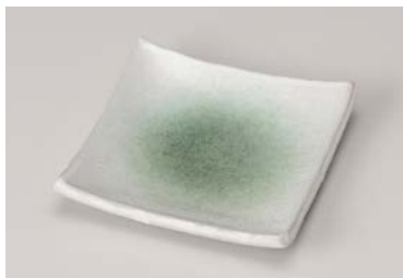
ロ211-107 新緑正角銘々皿 12.5cm (120入・磁) 1,000円