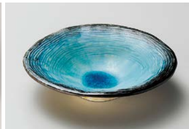
ト209-267 スカイストライプ5寸皿 φ17×3.5cm(60入・磁) 920円