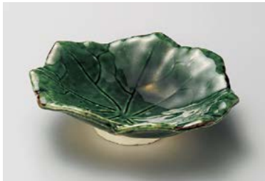
タ209-197 織部芙蓉葉型小皿 15.5×13×4cm(60入・陶) 1,400円