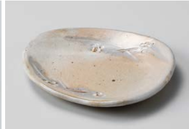
ミ209-087 手造り粉引華紋(土物)楕円皿 15.3×12.5×2.3cm(80入・陶) 1,400円