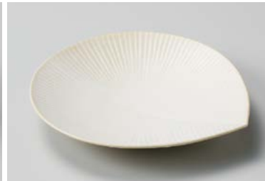
ト209-177 金砂 萌 18cm銘々皿 18×16.3×2.3cm(80入・磁) 790円 ト209-187 金砂 萌 12.5cm小皿 12.5×11.5×2.2cm(150入・磁) 490円