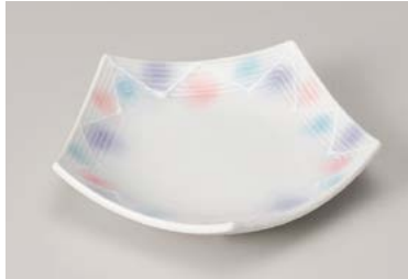
ミ209-027 淡雪三色吹五角 フルーツ皿 16×16×3.3cm(100入・磁) 1,680円