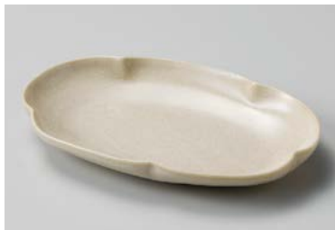
ヨ209-247 うのふ サブプレート #033 20×12.7×2.5cm(50入・磁) 900円