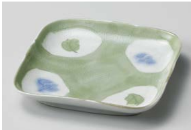
ト209-097 カトレアブルーなで角 デザート皿 14.5×14.5×2.3cm(75入・磁) 1,200円