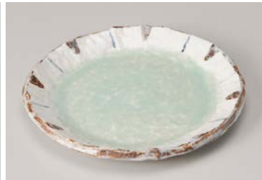
ロ209-217 ヒワ釉測十草6.0丸皿 φ18.6×2.5cm(80入・磁) 1,240円