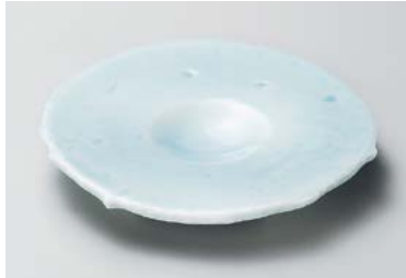
タ209-067 青白磁6.0丸くぼみ皿 φ18.5×2.7cm(30入・磁) 1,700円