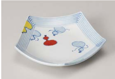
ミ209-017 赤絵瓢五角 フルーツ皿 16×16×3.3cm(100入・磁) 1,780円