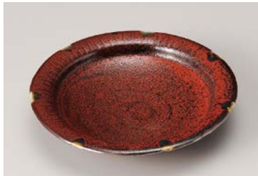
タ209-107 紅柚子天目5.7皿 φ17.2×3.7cm(30入・磁) 1,700円