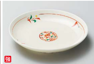
ホ209-227 赤絵みのり5.0皿 16.5cm(80入・強) 1,400円