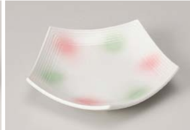
ユ209-047 淡雪二色吹 五角皿(小) 16×16×3.3cm(60入・磁) 1,500円