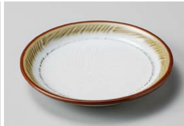
ア209-167 乳白15.5cm丸皿 φ15.5×2.4cm(60入・磁) 1,200円