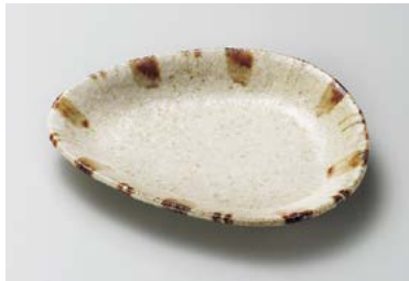
カ209-207 白砂錆十草三角取皿 19×15.4×3cm(40入・磁) 1,350円