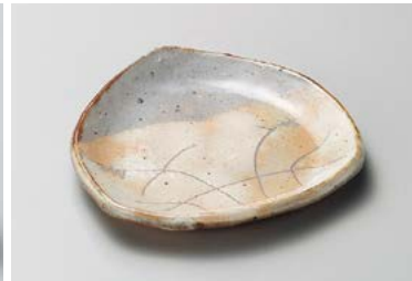
ミ209-137 粉引刷毛目三角皿 14.9×14.3×1.7cm(100入・陶) 1,500円