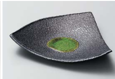
ネ209-117 湖畔三角中皿 17×16.5cm(60入・磁) 1,700円 ネ209-127 湖畔三角銘々皿 14.5×12.5cm(80入・磁) 1,300円