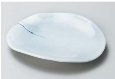
ツ209-237 青白磁切合皿 17.2×15.2×2.2cm(60入・磁) 1,200円