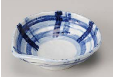
ミ209-057 呉須刷毛格子 片口45鉢 14×13.5×4.3cm(80入・磁) 1,900円