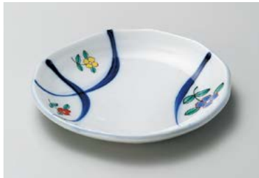
ミ209-157 錦花紋フルーツ皿 φ15.4×1.7cm(100入・磁) 1,480円