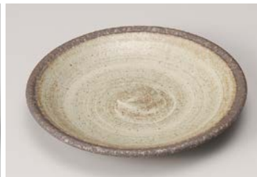
カ209-257 年輪円6.5寸平皿 φ19.6×2.8cm(40入・磁) 800円