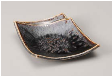
イ209-147 白土孔雀折紙 中皿 13×12×3.2cm(100入・磁) 1,550円