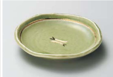
ア209-077 グリーン魚紋6.0多用皿 17×15.6×3cm(40入・磁) 1,980円