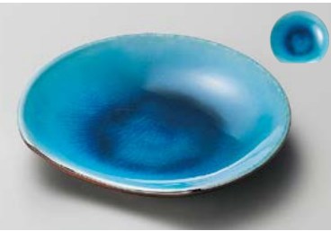
イ208-187 トルコ盛半月皿 15.5×13.8×2.8cm (80入・磁) 2,000円