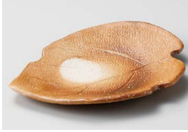
×208-037 焼ノ葉形皿 23×17×3.5cm (50入) 2,400円