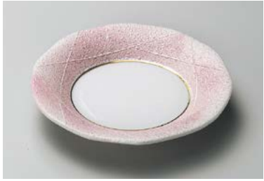
ミ208-137 ピンク銀彩フルーツ皿 φ15.5×2.6cm (100入・磁) 2,400円