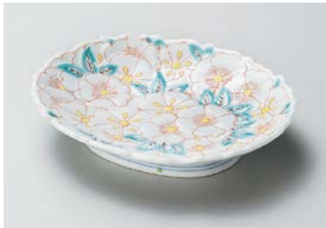
ミ208-117 花絵和皿 φ16.5×13.8cm (80入・磁) 2,850円