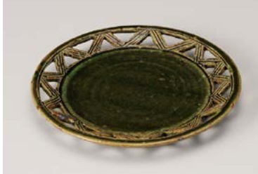
ミ208-077 織部 スカシ 6.0和皿 φ18.5×2cm (60入・陶) 2,800円