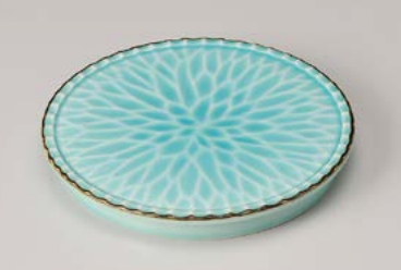
キ208-067 淵錆マリンブルー菊彫高台丸皿 φ17.4×2cm (60入・磁) 3,050円