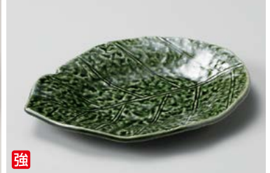
ウ208-087 織部釉葉型皿 φ20.5×15.5×2.4cm (50入・強) 1,330円