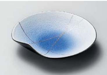
ト208-107 コバルト銀彩5.0皿 15.7×2.8cm (60入・磁) 2,750円