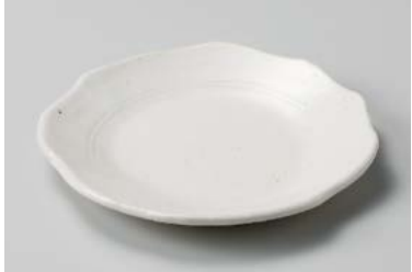
ミ208-057 手造りモダン粉引(土物)花形5.5皿 16.5×2.0cm (80入・陶) 1,480円