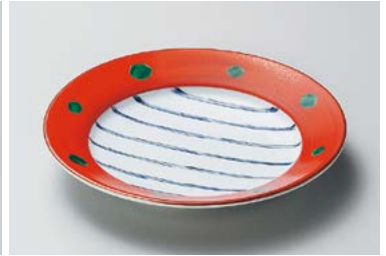
ミ208-027 朱巻十草6.0リム皿 φ18.5×3.1cm (60入・磁) 3,700円