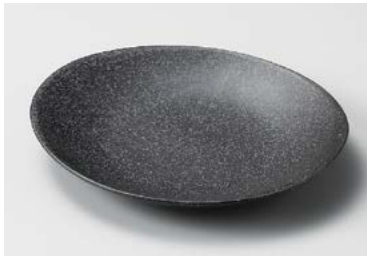
フ208-197 鉄ペーパー楕円受皿 16.9×14.7×2.6cm (80入・陶) 650円