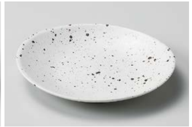
フ208-207 白斑点楕円受皿 16.9×14.7×2.6cm (80入・陶) 650円