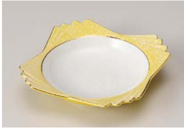
ミ208-157 黄釉 四ツ重ね 小鉢 13.5×13.5×3.3cm (90入・磁) 2,200円