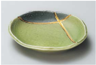
ア208-177 若草金彩6.0皿 17.2×15.7×3.2cm (60入・磁) 2,000円