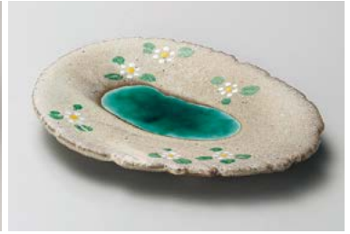
オ208-167 グリン流楕円銘々皿 17.7×12.3×2cm (100入・陶) 2,250円