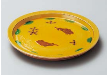
ミ208-017 交趾双魚和皿 φ17.1×2cm (60入・磁) 4,700円