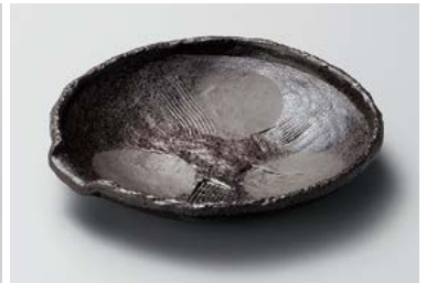
ネ208-127 炭化土ボタモチ櫛目片口6.0皿 18.3×18×3cm (40入・磁) 2,450円