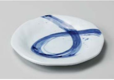
ア208-147 青空銘々皿 16.4×16.2×1.5cm (60入・磁) 1,350円