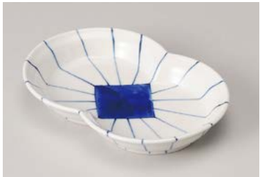
オ208-097 紺筋輪つなぎ皿 16.7×11.1×2.8cm (90入・磁) (美濃焼) 2,900円