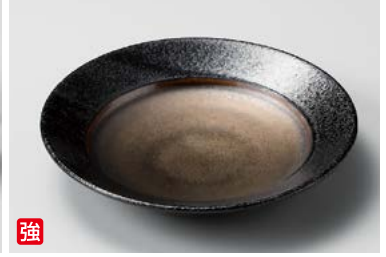
ツ208-047 本窯金彩6.0リム皿 φ18.2×3cm (40入・強) 2,100円