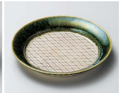
ホ206-107 織部菱紋6.0深皿 φ18.7×2.8cm (60入・陶) 2,150円