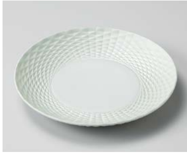
ツ206-027 グリン吹ダイヤカット7.0皿 φ21.3×3cm (30入・磁) 3,000円