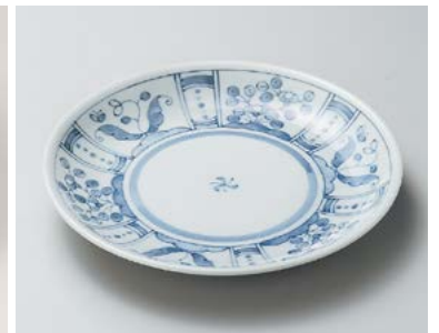
ヤ206-257 花間取7.0皿 φ23cm (40入・磁) 1,700円