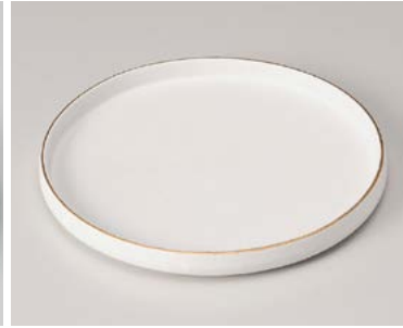
カ206-037 測金白マット切立皿(大) φ21×2.2cm (25入・磁) 3,200円 カ206-047 測金白マット切立皿(小) φ18×2.2cm (30入・磁) 2,800円