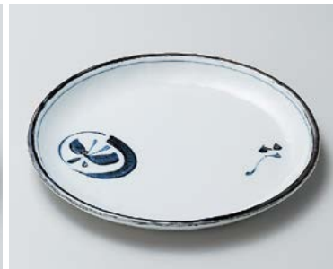
口206-197 丸紋蝶7.0丸皿 φ21×2cm (40入・磁) 2,020円