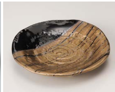
ト206-247 金塗り分 六寸皿 φ19.5×3.3cm (30入・陶) 1,700円