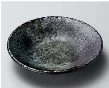
タ206-167 深海6.0深皿 φ19.5×4cm (40入・磁) 1,900円