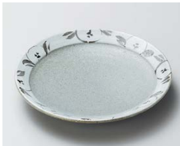
口206-187 唐津椿6.0丸皿 φ17.8×3cm (80入・陶) 1,950円