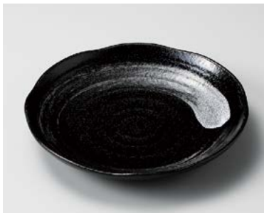
ネ206-227 勢刷毛目7.5皿 23×3.3cm (60入・磁) 860円