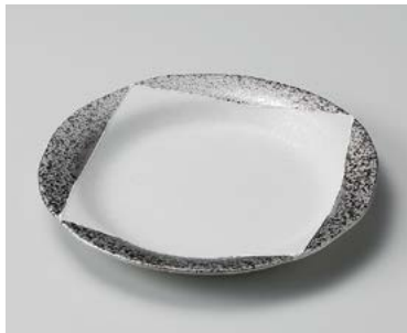
ユ206-087 プラチナスクエア-6.5皿 φ19.5×2.3cm (40入・磁) 2,500円