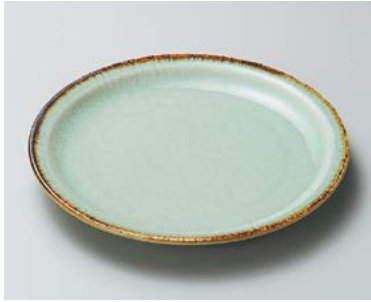
ト206-017 翠玉7.0丸皿(リム) φ21.5×2.6cm (30入・磁) 3,050円