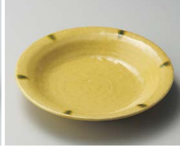
オ206-137 ネオクラフト 黄瀬戸6.0深皿 φ19.5×4.2cm (40入・磁) 1,900円 オ206-147 ネオクラフト 黄瀬戸5.5鉢 φ16.8×4.2cm (40入・磁) 1,700円