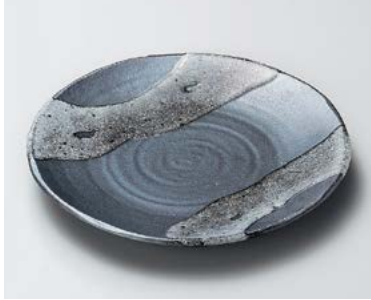
ツ206-117 天目白流波型7.0皿 φ21.5×2.5cm (30入・陶) 2,150円