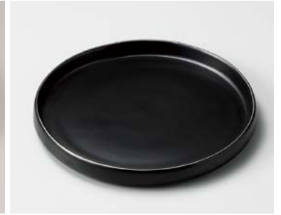
カ206-057 測銀黒マット切立皿(小) φ18×2.2cm (40入・磁) 2,700円