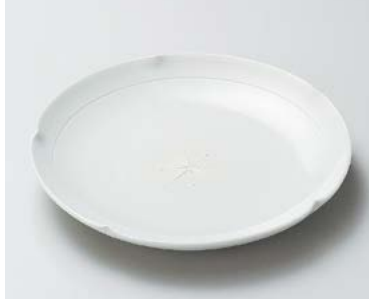
ト206-127 青磁輪花皿 φ20×3cm (40入・磁) 2,150円