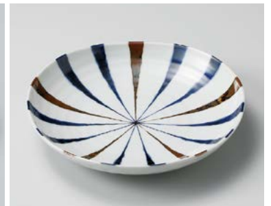
タ206-207 藍十草三角80皿 22.7×22.7×4.3cm (30入・磁) 850円