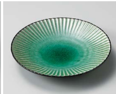
ハ206-097 黒土化粧しのぎ7.0皿(グリーン) φ22×3.5cm (36入・陶) 2,100円