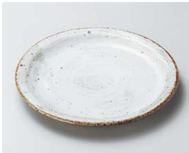
イ206-067 白刷毛たたき7.0皿 φ21×2.5cm (30入・陶) 2,500円 イ206-077 白刷毛たたき6.0皿 φ17.6×2.5cm (60入・陶) 1,700円