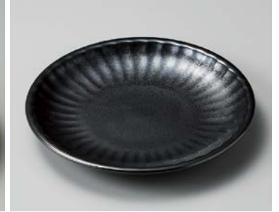
イ206-157 鉄結晶削ぎ6.0皿 φ21.2×3cm (40入・磁) 980円