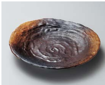
イ206-237 伊賀風 厚口7.5皿 23.5×3.7cm (30入・磁) 1,800円