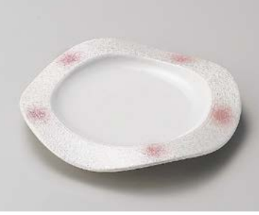
ミ198-157 ピンクボカシラスター和皿 19.5×2.5cm (40入・磁) 2,950円