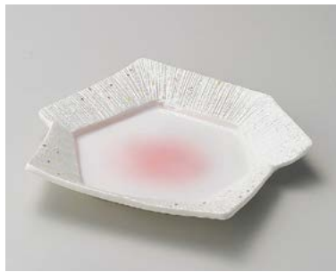
ミ198-107 ピンク吹一珍ラスター変形皿 24×19×3.5cm (50入・磁) 3,200円