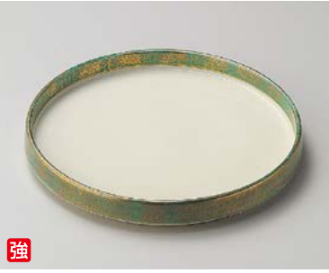
ミ198-027 グリン金タタキ7.0切立丸皿 φ21×2.6cm (40入・強) 4,400円