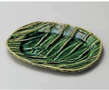
ミ198-117 織部楕円型波彫和皿 20.5×17.5×2.2cm (50入・陶) 2,880円