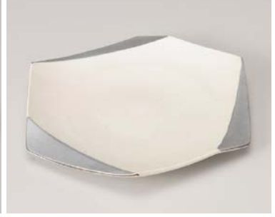
ミ198-177 銀彩白吹六角皿 22×19.7×2.8cm (40入・磁) 2,700円