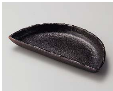
ア198-187 南蛮半月前菜皿 26×13.6×2.8cm (30入・陶) 2,500円