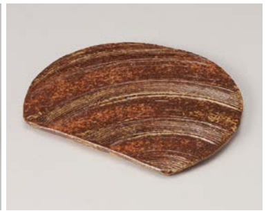
ミ198-137 備前風くし目半月6.5寸プレート 20×17cm (50入・陶) 2,800円