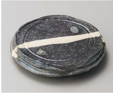
×198-037 黒窯変掛け分け5.7足付丸皿 φ17.2×3cm (30入・陶) 4,050円