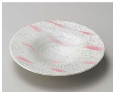
ミ198-057 ピンクー珍帽子型和皿 21.3×3.2cm (40入・磁) 3,800円