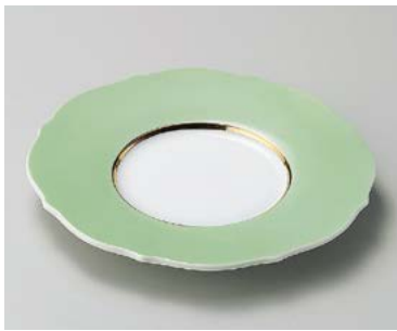
ミ198-127 ヒワ吹前菜皿 21.5×20.5×2.7cm (50入・磁) 3,100円