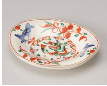
カ198-017 粉引花鳥楕円皿 19.2×16.2×3.5cm (40入・陶) 6,000円