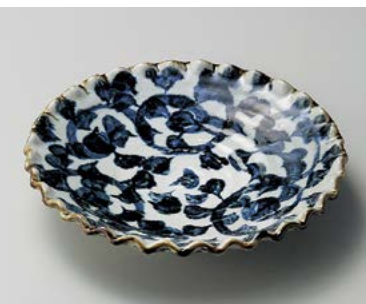
オ198-197 タコ唐草波型7.5皿 φ23×4.7cm (40入・陶) 2,600円