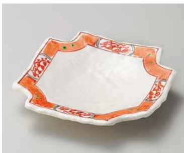
オ198-207 赤絵四ツ切皿 17.8×17.8×3cm (60入・磁) 2,500円