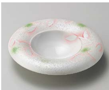
ミ198-077 ラスターピンク芦ハット型前菜皿 φ21×4.5cm (40入・磁) 3,200円