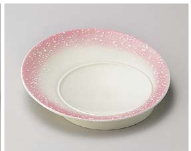
ミ198-217 ピンク白吹満月7寸皿 φ20.3×3cm (30入・磁) 2,400円