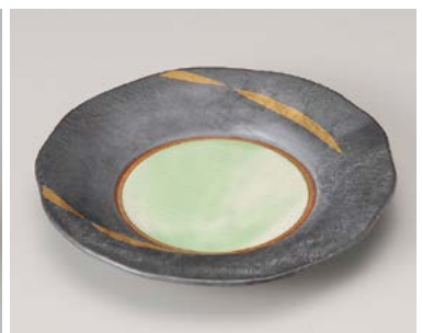
ミ198-087 金カスリ和皿 21×3cm (50入・磁) 3,250円