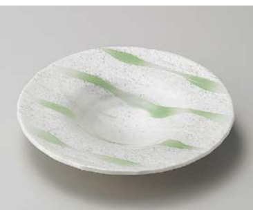
ミ198-067 ラスターヒワ筋和皿 21.3×3.2cm (40入・磁) 3,800円