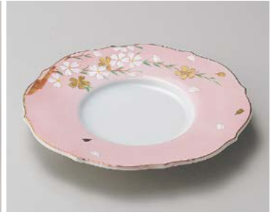
ミ198-047 桜吹雪前菜皿 21.5×20.5×2.7cm (50入・磁) 3,900円