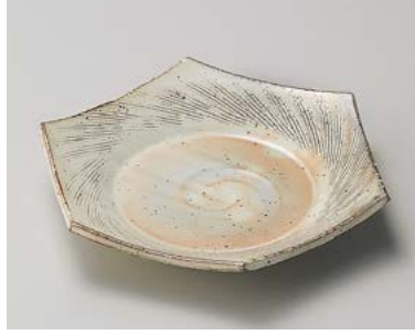
テ198-147 粉引櫛目六角皿 19.5×17.5×4.5cm (30入・陶) 3,150円