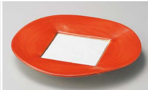
ミ195-057 朱巻内白八寸皿 φ24.6×2.9cm (30入・磁)