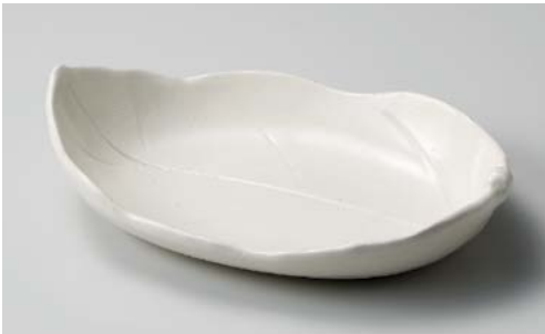
ミ195-127 手造りモダン粉引(土物)リーフボール 27.8×17.3×6.5cm (30入・陶)