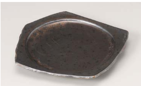
ミ195-157 金結晶変形五角皿 25×24×3.2cm (30入・磁)