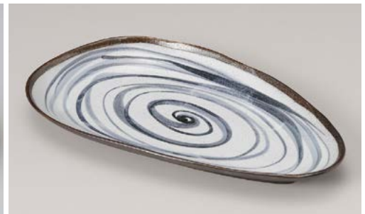
オ195-107 黒潮三角尺長皿 33×18.5×3.5cm (30入・磁)