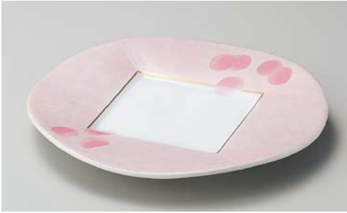
ミ195-017 ピンク吹銀彩80皿 φ24.5×2.9cm (40入・磁)