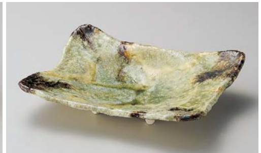
ミ195-067 灰釉流角8.0皿 26.2×20×6cm (40入・磁)