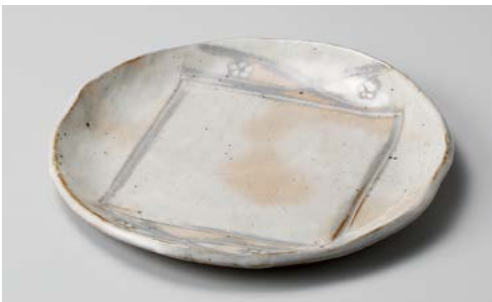
ミ195-077 手造り粉引華紋(土物)8.0丸皿 φ24.8cm (30入・陶)