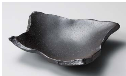
ツ195-167 荒黒ちぎり8.0盛皿 24×17.5×5.5cm (20入・磁)