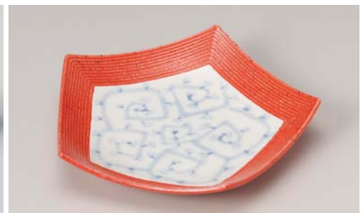
ミ195-187 紅柚子五角唐草盛皿 23.5×23.5×4.5cm (40入・磁)