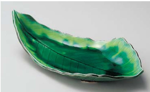
ト195-047 緑釉木の葉尺二皿 35×18×8cm (20入・磁)