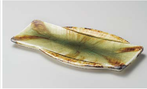
ミ195-027 灰釉耳付長大皿 30.8×17.3×1.5cm (30入・磁)