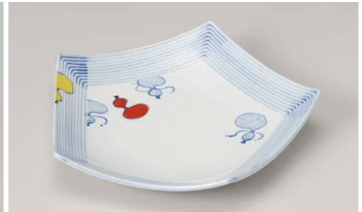
ミ195-147 赤絵瓢五角盛皿 23.5×23.5×4.5cm (40入・磁)