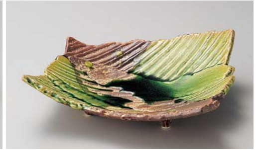
ト195-037 サビ釉ヒワ流スジ彫変形盛皿 26.5×24×7.5cm (12入・磁)