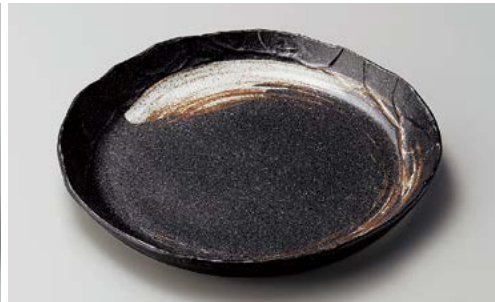
イ195-137 栗色刷毛目塗り壁パスタ皿 φ26.5×3cm (30入・磁)