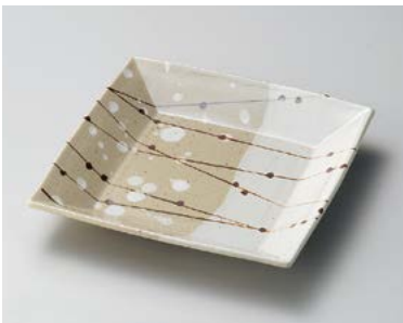
ユ185-057 錆格子塗分正角皿(大) 20.5×20.5×3.4cm (30入・磁) 1,800円