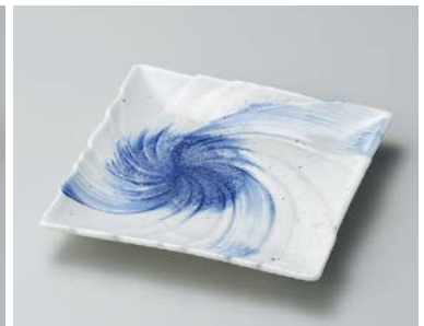
タ185-107 星雲うず型正角皿 19×19×2.8cm (30入・磁) 1,400円