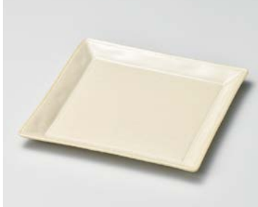
ヨ185-017 うのふメインプレート角 #003 21.5×21.5×2cm (50入・磁) 1,800円