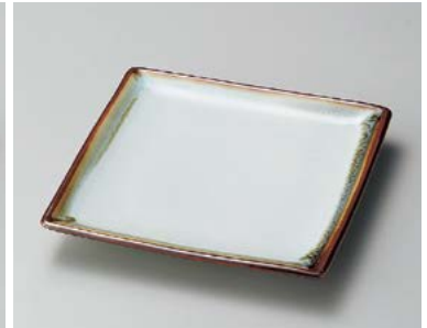
オ185-047 白天目流し正角天ぶら皿 19×19cm (40入・磁) 1,800円