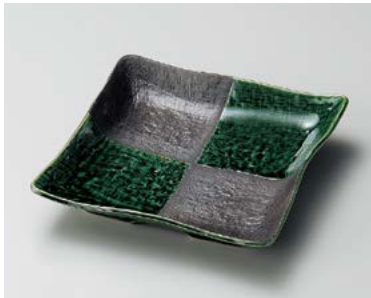
ミ185-137 織部市松正角和皿 18×18×3.2cm (60入・磁) 1,050円