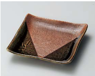
タ185-157 美濃伊賀正角皿 18×18×3.2cm (30入・磁) 1,200円