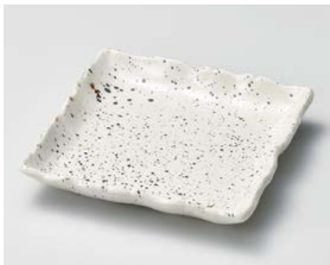
ミ185-177 萩志野子ギリ正角和皿 φ17×3.5cm (60入・磁) 950円