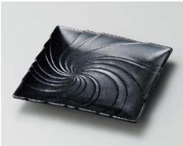
タ185-117 紺斑点うず型正角皿 19×19×2.8cm (30入・磁) 1,300円