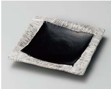
オ185-037 黒織部四辺筋皿 φ18×2cm (40入・磁) 2,850円