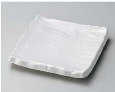
キ185-087 白マット荒彫角皿(大) 20.3×20.3×3.6cm (26入・磁) 1,950円 キ185-097 白マット荒彫角皿(小) 15.7×15.7×3.4cm (40入・磁) 1,200円