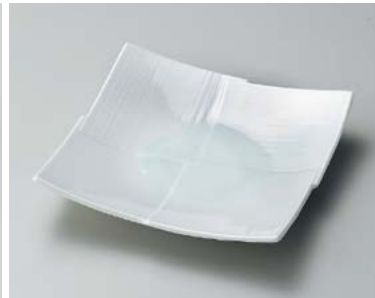
ト185-127 青白磁市松彫6.0皿 18.7×18.7×3.7cm (20入・磁) 1,350円