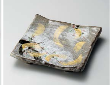
カ185-027 乾山春秋正角5.5天皿 17.5×17.5×4cm (30入・陶) 3,500円