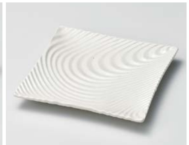
キ185-187 粉引釉 風紋正角皿(大) 19.8×19.8×2.5cm (30入・磁) 1,550円 キ185-197 粉引釉 風紋正角皿(小) 16.6×16.6×2cm (40入・磁) 1,150円