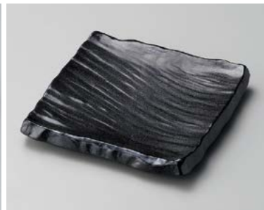
キ185-067 黒備前荒彫角皿(大) 20.3×20.3×3.6cm (26入・磁) 1,950円 キ185-077 黒備前荒彫角皿(小) 15.7×15.7×3.4cm (40入・磁) 1,200円