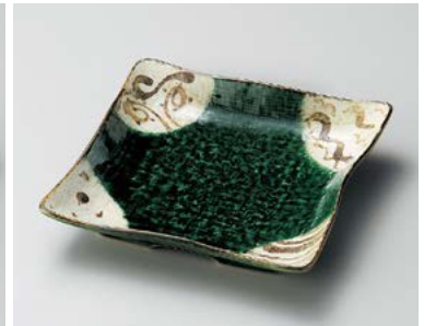
イ185-147 里山織部7.0正角皿 18×18×3.5cm (40入・磁) 1,150円