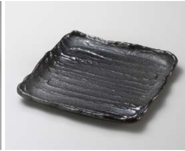
カ183-097 金吹黒砂荒ソギ22cm角皿 22.7×22.5×2.5cm (40入・磁) 2,450円