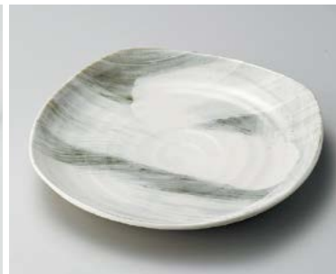
ア183-257 乱れ刷毛25.5なで角皿 25.5×25.5×4cm (24入・磁) 1,480円