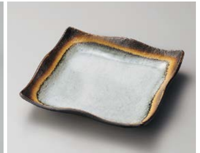
ト183-227 アカネ23cm正角皿 23×23×4.5cm (20入・磁) 2,100円