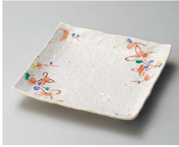
ミ183-027 粉引赤絵小花正角7.0皿 22×22×3cm (40入・磁) 2,550円