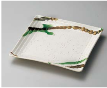
口183-087 粉引黒オリベ流し段々大皿 23.5×23.5×2.8cm (20入・磁) 3,150円