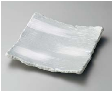
ヤ183-067 新川凜23cm正角皿 23×23×4cm (20入・磁) 2,600円 ヤ183-077 新川凜19cm正角皿 19.5×19.5×3cm (40入・磁) 1,650円