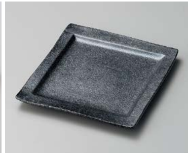
イ183-217 銀黒回角中皿 21×18.7×1.8cm (20入・磁) 2,280円