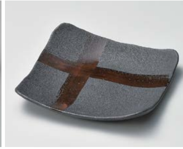
×183-037 黒鮫肌7.0角皿 25×25×3.7cm (30入) 4,000円 ×183-047 黒鮫肌5.0角皿 15×14.5×3.3cm (60入) 2,680円