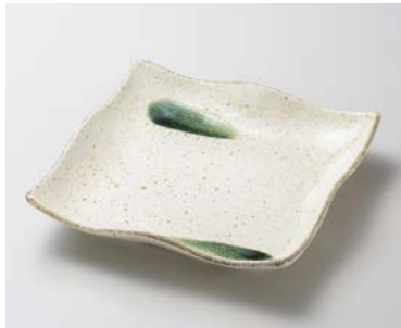
ミ183-197 土化粧 正角9.0皿 23.3×23.3×4.3cm (30入・磁) 1,950円 ミ183-207 土化粧 正角7.0皿 18×18×3.5cm (40入・磁) 1,050円