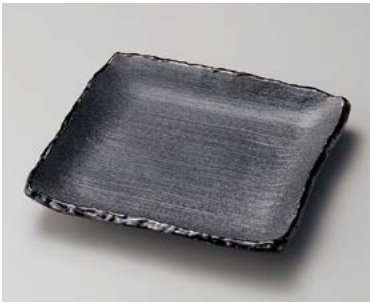
ネ183-117 瀏黒天目四角皿 22.2×22.2×3.5cm (20入・磁) 2,250円