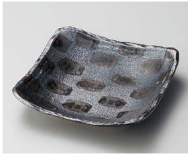
口183-127 黒市松7.0角鉢 20.3×20.5×4.2cm (30入・磁) 2,840円