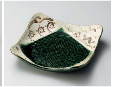
イ183-107 里山織部9.0正角皿 23.5×23.5×6cm (20入・磁) 2,350円