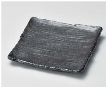
ヤ183-247 黒備前凜正角皿 19.5×19.5×3cm (40入・磁) 1,000円