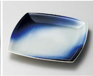
口183-137 蒼空角皿(大) 22.3×22.3×2.5cm (40入・陶) 2,250円 口183-147 蒼空角皿(中) 18.2×18.2×2.3cm (60入・陶) 1,580円 口183-157 蒼空角皿(小) 13.2×13.2×1.8cm (120入・陶) 750円