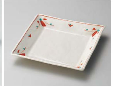
ユ183-057 赤絵花正角皿 22×3cm (20入・陶) 2,650円