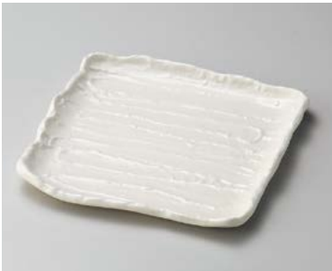
イ183-187 練色荒そぎ7.0角皿 22×21.5×2.3cm (30入・磁) 2,350円