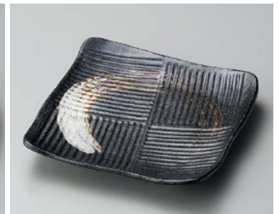
タ183-267 黒刷毛笹舟四角皿 20×20×3.8cm (20入・磁) 1,300円