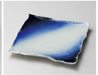
口183-167 蒼空四方皿(大) 23×23×2.8cm (40入・陶) 2,250円 口183-177 蒼空四方皿(小) 20×20×2.4cm (60入・陶) 1,580円