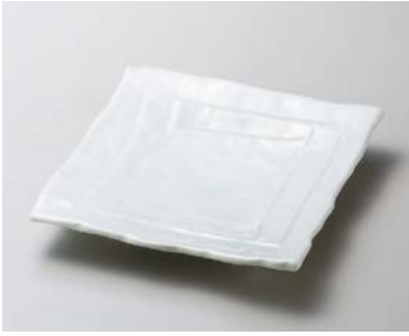
キ183-017 青白磁角6.5皿 20.3×20.3×3.4cm (40入・磁) 2,800円