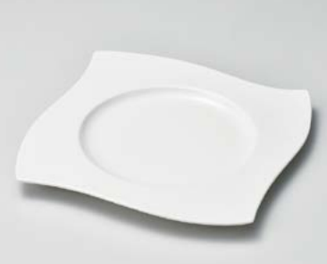
ミ180-107 NBエクシードセーヌ10吋平皿 24.8×24.8×2.5cm (12入・磁)(中国) 3,150円