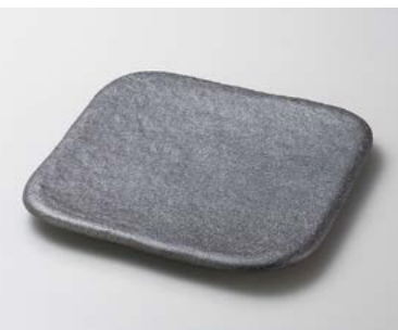
×180-157 黒窯変角白掛け分け6.6足付角皿 20×20×3cm (30入・陶) 4,700円