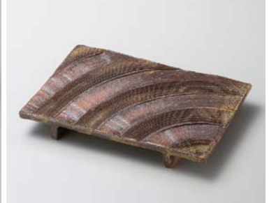
ミ180-087 備前風くし目ゲタ足長角盛皿 26.5×17.5×3.5cm (25入・陶) 4,980円