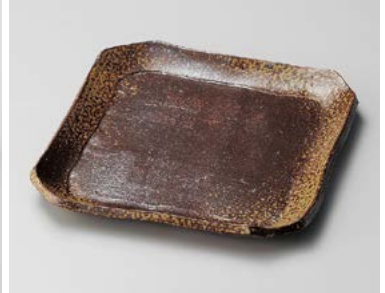
ミ180-047 手造り備前風角尺皿 25.4×25×2.6cm (15入・陶) 5,450円