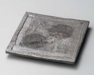
×180-067 黒窯変ボタモチ正角皿 22×22×2.8cm (40入・陶) 5,500円