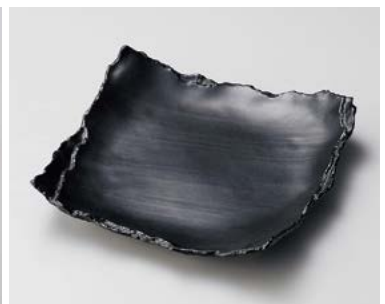
フ180-177 鉄ペーパーパレット25cm角盛皿 25×25×2.7cm (20入・磁) 2,880円