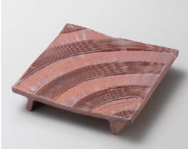
ミ180-097 火色くし目ゲタ足正角盛皿 19×19×4cm (25入・陶) 4,600円