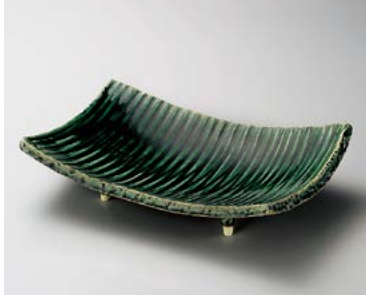
ミ180-127 織部ソギ長角盛鉢 28×18×6.7cm (40入・陶) 4,400円