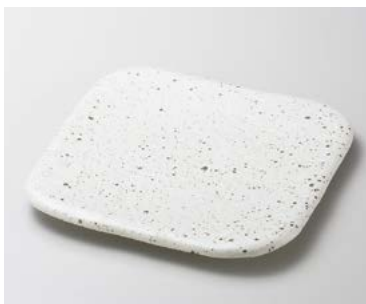
×180-167 黒窯変角白掛け分け5.0足付角皿 15×15×3.3cm (40入・陶) 2,450円