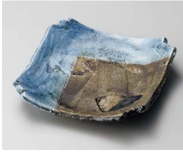
カ180-017 白磁十字浅鉢 21.5×21.5×4.5cm (30入・陶) 7,300円