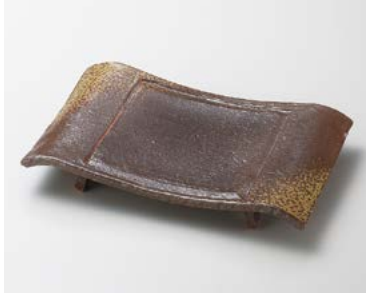
ミ180-037 手造り備前風弓型8.5前菜長角皿 26.5×16.5×3.8cm (30入・陶) 4,600円