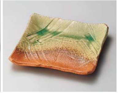
ト180-027 伊賀緑釉正角皿(手造り) 21.5×21×4cm (20入・陶) 5,800円