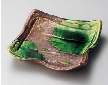
ト180-057 錆釉ヒワ流し四つ押し8寸皿 24×24×5.5cm (18入・磁) 5,400円