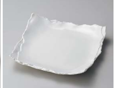
カ180-137 白マット重ね8.5皿 24×24×4.3cm (20入・磁) 4,500円