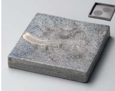
×180-077 黒窯変クシ目6.8角皿(両面使用可) 20.5×20.5×3cm (30入・陶) 5,350円