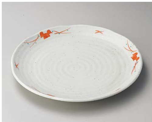
テ172-117 赤絵三ツ葉尺皿 φ31×2.5cm (20入・磁) 2,400円 テ172-127 赤絵三ツ葉8.0盛皿 24.5cm (30入・磁) 1,380円 テ172-137 赤絵三ツ葉7.0皿 21.5cm (40入・磁) 1,050円 テ172-147 赤絵三ツ葉5.0皿 16.5cm (120入・磁) 720円