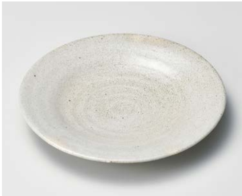
カ172-097 錆梅花皮7寸プレート φ24.5×3.6cm (30入・陶)