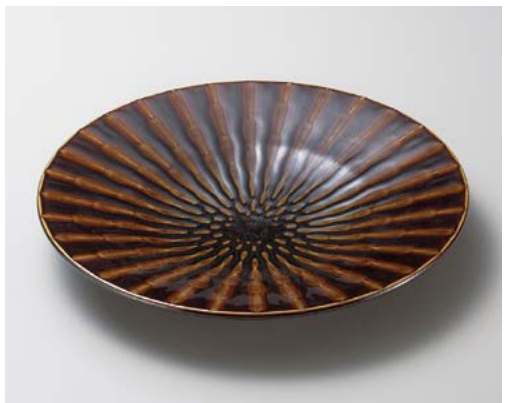
ア172-177 竹林アメ30cm皿 φ30×4cm (16入・磁) 2,350円 ア172-187 竹林アメ20cm皿 φ19.7×3.3cm (40入・磁) 760円