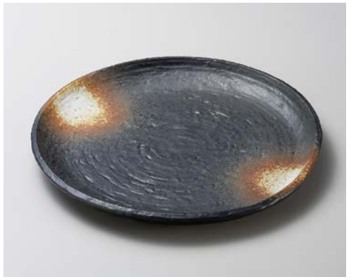
キ172-067 黒備前丸9.0皿 φ28×3cm (20入・陶)