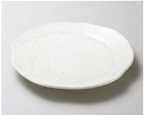
カ172-107 白波型9.0皿 27.5×27×3.5cm (20入・磁)