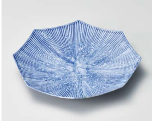
ト172-037 インディゴブルー彫八角 8寸皿 26.3×24.5×4.2cm (30入・磁)