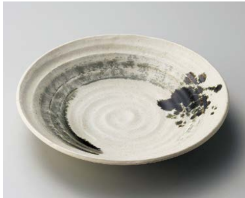
カ172-087 荒引大皿 φ29×5.4cm (20入・磁)