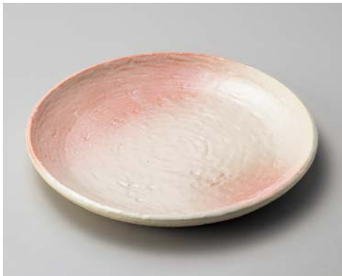
ヤ172-057 桜志野9.0丸皿 27.5×3cm (30入・磁)