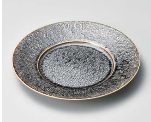
ア172-017 輝銀鉞白25cm丸皿 φ25×3cm (30入・陶)