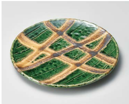
イ172-047 織部乱線8.0皿 φ25×2.7cm (20入・磁)