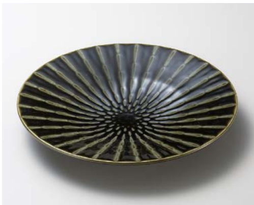
ア172-157 竹林織部30cm皿 φ30×4cm (16入・磁) 2,350円 ア172-167 竹林織部20cm皿 φ19.7×3.3cm (40入・磁) 760円