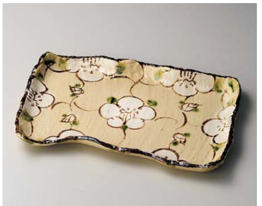
ソ155-137 格子花変形長角皿 37×24.5×3.5cm (10入・陶) 6,300円