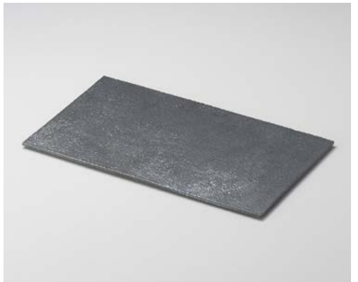
カ155-077 黒モダンプレート中長皿 37×22×1cm (20入・陶) 8,900円