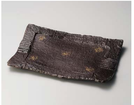
ソ155-107 炭化土砂目長角13.0盛皿 38×27.4×4cm (15入・陶) 7,700円