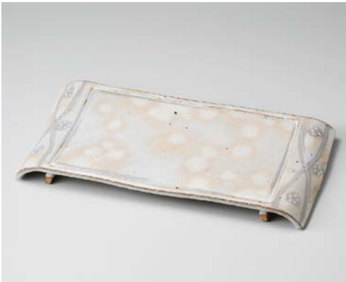
ミ155-087 手造り粉引華紋(土物)弓型長角盛皿 42×20×3.5cm (10入・陶) 18,200円