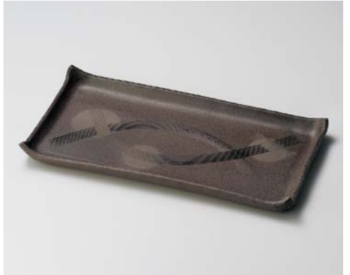
ト155-037 炭化尺四盛皿 41×21×3.2cm (8入・陶) 10,000円