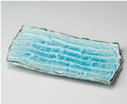
キ155-097 潤錆マリブルー削ぎ彫長角大皿 37×19.5×2.5cm (10入・磁) 6,200円