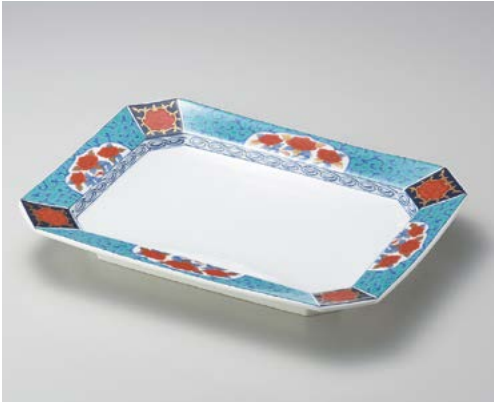
テ155-017 緑彩唐草赤牡丹長角大盛皿 42.3×32.5×5.5cm (10入・磁) 50,000円