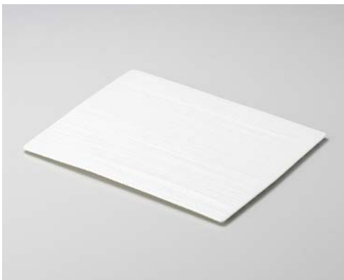
ア155-127 長角平皿 ホワイト 32.5×26×1cm (12入・磁) 6,800円