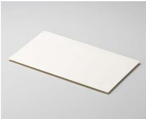
カ155-067 白モダンプレート中長皿 37×22×1cm (20入・陶) 8,900円