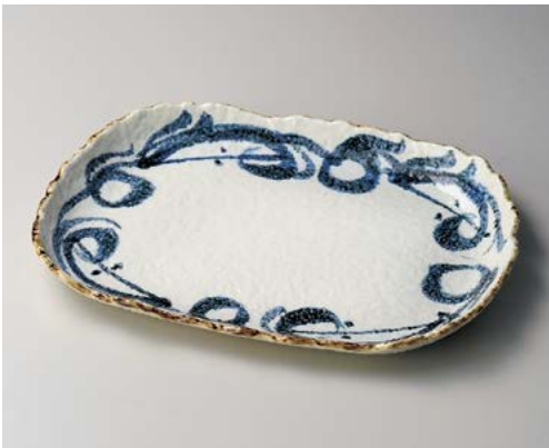
テ155-047 波唐草尺二皿 37×26.5cm (15入・磁) 9,800円 テ155-057 波唐草9.0皿 28.5×18cm (20入・磁) 4,700円