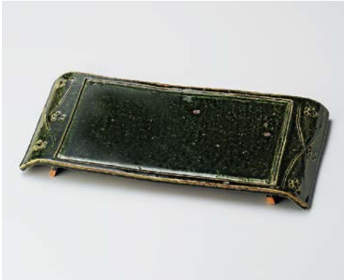
ミ155-027 手造り織部華紋弓型長角盛込皿 42.5×20.3×3.5cm (10入・陶) 18,100円