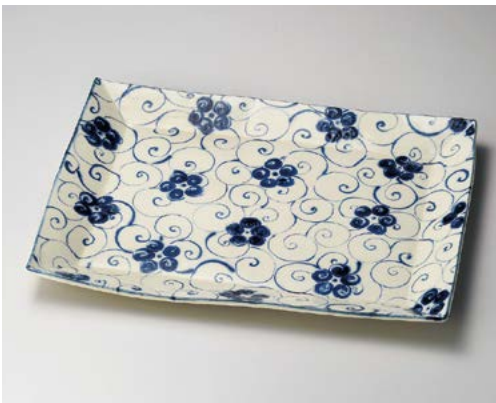
≒154-037 安南花唐草特大長角パーティー皿(手造り) 51×38.5×4.5cm (4入・陶) 40,000円