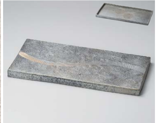
×154-017 黒窯変櫛目16.0長角皿(両面使用可) 48.5×24×2.7cm (5入・陶) 25,700円