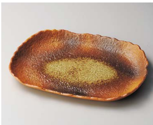
テ154-077 南蛮吹尺二皿 37×26.5cm (15入・磁) 10,000円 テ154-087 南蛮吹9.0皿 28.5×18cm (20入・磁) 4,700円