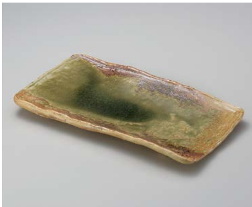
×154-047 灰釉15.0長方皿 47×26×3.5cm (5入・陶) (信楽焼) 18,900円