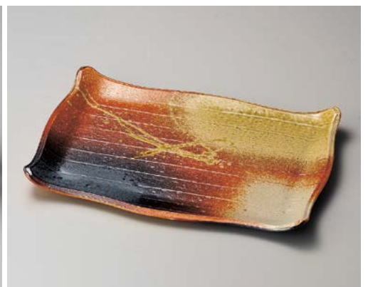
×154-097 古信楽12.0長角皿 35.5×24.5×3cm (10入・陶) 9,000円