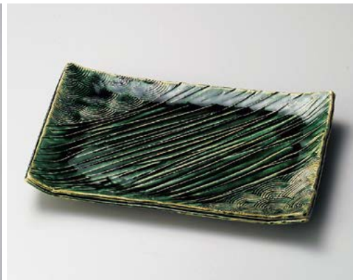
≒154-057 織部波紋彫足付大盛込皿 35.5×23×6.3cm (10入・陶) 14,000円