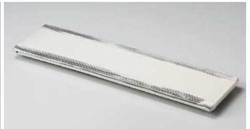
ホ151-067 白粉引15.0長皿 47×12×2.2cm (10入・陶)