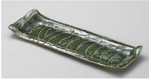
ツ151-027 織部ガタ彫長大皿 48×17×3.9cm (20入・陶)