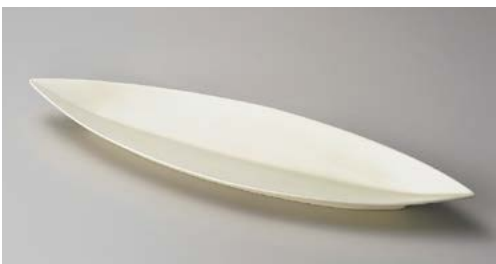
オ151-137 笹型大皿白 52.4×15×4.2cm (20入・陶) オ151-147 笹型中皿白 44×10.5×2.8cm (40入・陶) オ151-157 笹型小皿白 30.3×7.5×2.7cm (60入・陶)