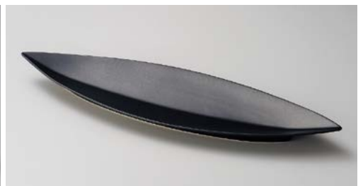
オ151-197 笹型大皿黒 52.4×15×4.2cm (20入・陶) オ151-207 笹型中皿黒 44×10.5×2.8cm (40入・陶) オ151-217 笹型小皿黒 30.3×7.5×2.7cm (60入・陶)