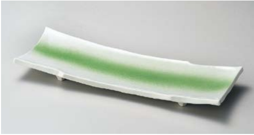
ミ151-017 ヒワ吹尺二ちぎり長角皿 36×12.7×4.2cm (30入・磁)