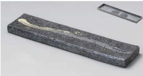
メ151-047 黒窯変クシ目12.0長角皿(両面使用可) 36×9×2cm (40入・陶)