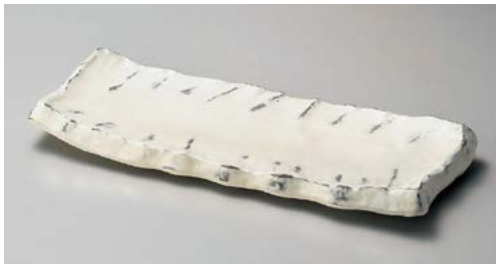
ツ151-057 粉引拭取りガタ彫12.0皿 37×14.5×4cm (12入・陶)