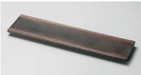
ツ151-107 炭化土吹15.0長皿 46×12×2.5cm (20入・陶)