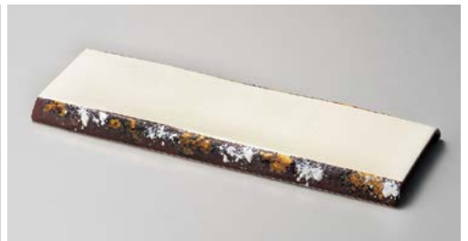
ミ151-097 アイボリー竹割長大皿 36.5×13.7×2.2cm (30入・磁)