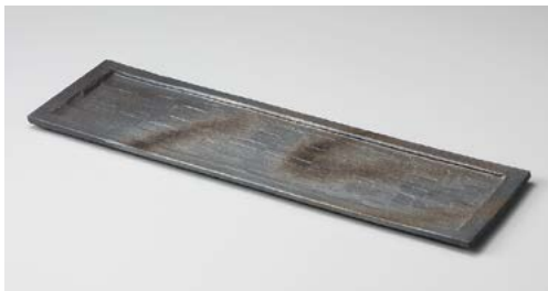
メ151-117 黒銀彩15.0長角皿 44.5×13×1.5cm (20入)