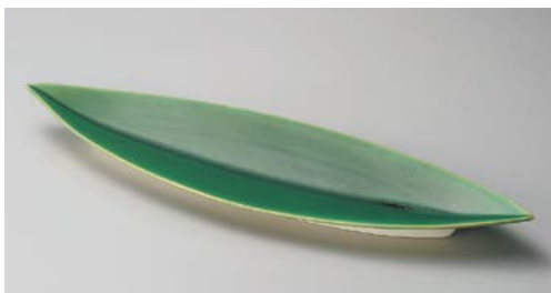
オ151-167 笹型大皿グリーン 52.4×15×4.2cm (20入・陶) オ151-177 笹型中皿グリーン 44×10.5×2.8cm (40入・陶) オ151-187 笹型小皿グリーン 30.3×7.5×2.7cm (60入・陶)