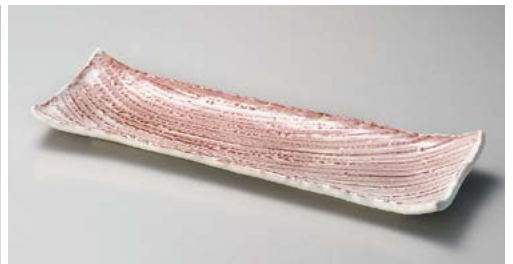
ト151-127 紅粉引枯山水 長角皿 大 41×13×4cm (15入・磁)