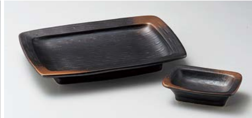
ト145-107 焼締なで角焼物皿(中) 20.7×14.3×2.9cm (40入・磁) 780円 ト145-117 焼締長角小皿 9.5×6.6×2.7cm (200入・磁) 300円