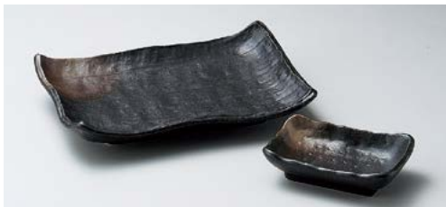
ヤ145-277 新黒備前洩波焼物皿 20.5×14.3×4cm (40入・磁) 900円 ヤ145-287 新黒備前角千代口 10.5×7×3cm (200入・磁) 450円