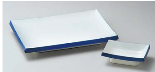
ロ145-167 切出し洩呉須8.0長角皿 20.5×14×2.5cm (40入・磁) 1,080円 ロ145-177 切出し洩呉須小皿 9×6.4×3cm (200入・磁) 330円