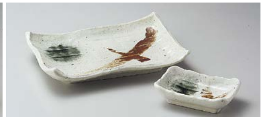
ヤ145-247 みやま洩波焼物皿 21×14×4cm (40入・磁) 900円 ヤ145-257 みやま銘々皿 16×11×3cm (80入・磁) 700円 ヤ145-267 みやま角千代口 10.7×7×3cm (200入・磁) 480円