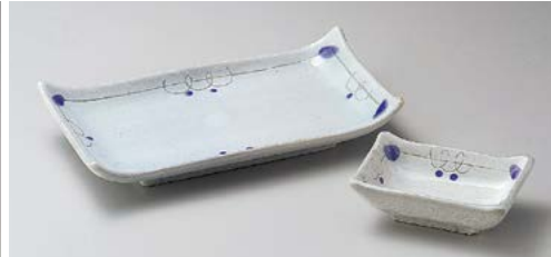
オ145-047 ボルドー焼物皿 21.7×12×3.8cm (40入・陶) 1,500円 オ145-057 ボルドー長角千代口 10.4×7×3.5cm (120入・陶) 1,040円