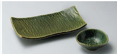
ア145-297 織部焼物皿 19.8×10.5×3.8cm (40入・陶) 950円 ア145-307 織部千代口 9×8.5×3.5cm (160入・陶) 470円