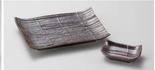
ロ145-127 鉄砂 長角8.0皿 20.4×14×3.1cm (40入・磁) 1,080円 ロ145-137 鉄砂 長角小皿 9.3×6×2.7cm (200入・磁) 340円