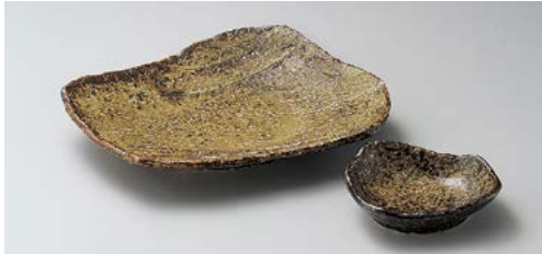
ホ145-087 不動荒瀬前菜焼物皿 21×17×4cm (40入・磁) 1,240円 ホ145-097 不動荒瀬千代口 10.5×9×3.2cm (120入・磁) 600円