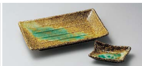
ミ145-357 岩清水長角焼物皿 22×14cm (60入・磁) 700円 ミ145-367 岩清水長角千代口 10×7×3cm (150入・磁) 400円