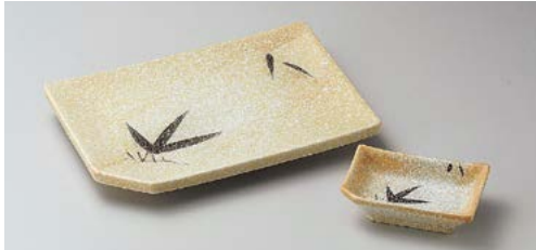
ヤ145-017 石焼織部笹長角8.0焼物皿 21.3×14.6cm (40入・磁) 1,300円 ヤ145-027 石焼織部笹長角7.0焼物皿 18.9×13cm (50入・磁) 1,100円 ヤ145-037 石焼織部笹長角千代口 9.7×6cm (200入・磁) 500円