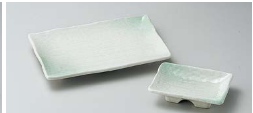
ホ145-317 グリーン吹たたき長角皿(小) 18.6×12.3×2.2cm (60入・磁) 840円 ホ145-327 グリーン吹たたき長角千代口 10.6×7.4×2.6cm (140入・磁) 420円