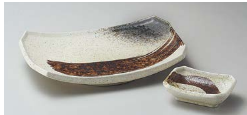
ハ145-227 志野サビ刷毛長角8.0皿 21.9×14.8×3.7cm (40入・磁) 970円 ハ145-237 志野サビ刷毛角千代久 8.7×6.4×2.7cm (200入・磁) 350円