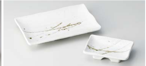
イ145-067 白乱刷毛たたき6.0長角皿 18.5×12×2.5cm (60入・磁) 880円 イ145-077 白乱刷毛たたき長角千代口 10.9×7.6×2.5cm (150入・磁) 420円