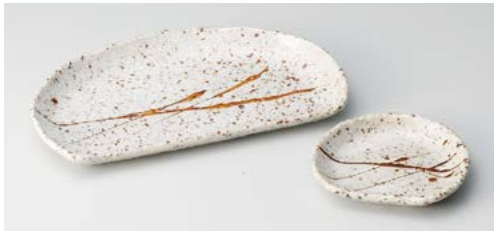
ホ145-147 アメ細刷毛半月焼物皿 21.7×12.6×2.2cm (60入・磁) 850円 ホ145-157 アメ細刷毛半月小皿 10.5×9.4×1.7cm (140入・磁) 400円