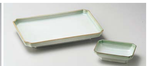
ロ145-377 葵7.0長角皿 19.5×12.5×2.7cm (40入・磁) 790円 ロ145-387 葵長角小皿 9.1×6.3×2.6cm (200入・磁) 250円

突出皿 長角皿 さんま皿 焼物皿 仕切皿 細長皿 長角大皿 変形大皿 丸大皿 角大皿 角中皿 楕円皿 変形中皿 丸中皿 フルーツ皿・銘々皿・取皿 和皿 小皿 萬古焼大皿 大鉢 盛鉢 ボール 焼酎サーバー ロックカップ フリーカップ 酒器 香置 卓上小物 そば小物・薬味皿 飲器(以テラ)・加ヘ皿 多用丼 小丼 そば丼・飯丼・蓋丼 飯器・飯碗 寿司湯呑 湯呑 煎茶・玉湯呑 抹茶碗 ボット・急須・土瓶 備前焼 有田焼・波佐見焼 土鍋・土瓶・割小物 すり鉢