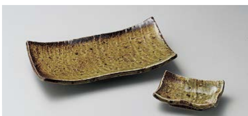
タ145-337 田園焼物皿 20×10.5×3.5cm (40入・陶) 770円 タ145-347 田園角千代口 9×6×3cm (100入・陶) 370円