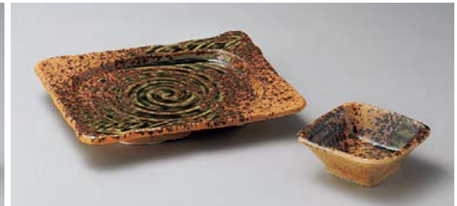
ア145-187 南蛮織部角焼物皿 18.5×15×2.7cm (40入・磁) 960円 ア145-197 南蛮織部角千代口 8.2×8.2×3.3cm (160入・磁) 430円