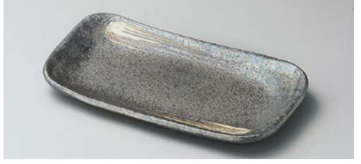
メ140-147 黒窯変刷毛目8.0焼物皿 24.5×12.8×1.8cm (30入・陶) 1,900円