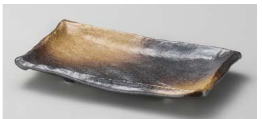
ヤ140-207 金茶吹匠 焼物皿 22.5×13.5×3.5cm (40入・磁) (美濃焼) 1,650円