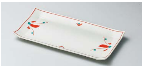
ユ140-197 赤絵花長角皿 24.5×12×2cm (40入・陶) 1,800円