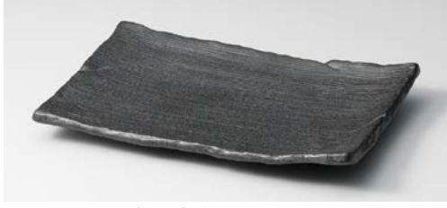
ヤ140-137 黒備前凜焼物皿 22×14.5×3cm (40入・磁) 1,000円