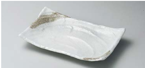
ネ140-157 白マット波型23cm焼物皿 23×13.8×4.6cm (40入・磁) 1,650円