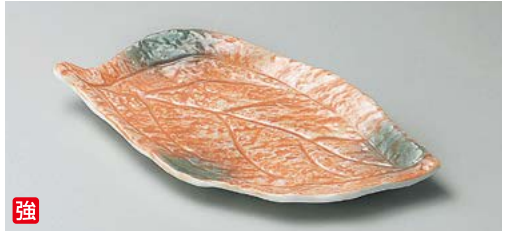
ツ140-037 オレンジ巻グリーン吹木ノ葉皿 23.5×12.5×2.5cm (40入・強) 2,500円