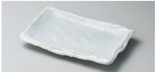
ア140-177 白釉23cm長角皿 22.5×13.5×3.5cm (30入・磁) 1,650円