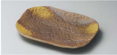
カ140-107 美膳岩焼物皿 21.5×14.5cm (40入・陶) 1,900円