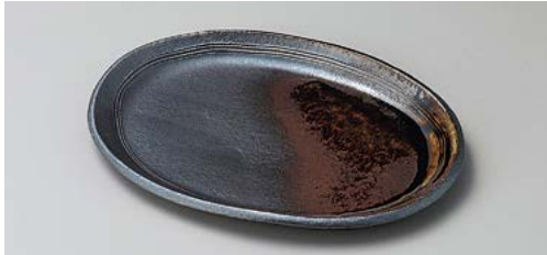
ネ140-047 いぶし楕円(中) 19×14.3cm (80入・陶) 2,150円