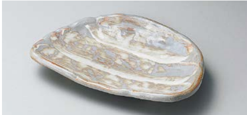
テ140-057 粉引刷毛半月皿 23×15.5×3.5cm (60入・陶) 2,000円