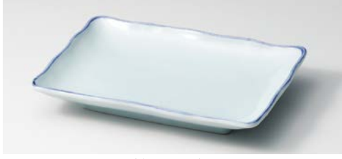
イ140-127 おふけ波瀾7.0長角皿 18.6×13.2×3cm (60入・磁) 1,150円