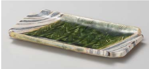
イ140-017 織部隅切焼き物皿 21.5×11.6×2cm (40入・陶) 5,300円

突出皿 長角皿 さんま皿 焼物皿 仕切皿 細長皿 長角大皿 変形大皿 丸大皿 角大皿 角中皿 楕円皿 変形中皿 丸中皿 フルーツ皿・ 銘々皿・取皿 和皿 小皿 萬古焼大皿 大鉢 盛鉢 ボール 焼酎 サーバー ロックカップ フリーカップ 酒器 箸置 卓上小物 そば小物・ 薬味皿 鉢皿/杯盤 カシメ 多用丼 小丼 そば丼・ 飯丼・蓋丼 飯器・飯碗 寿司湯呑 湯呑 煎茶・ 玉湯呑 抹茶碗 ポット・ 急須・土瓶 備前焼 有田焼・ 波佐見焼 土鍋・土瓶・ 割増 すり鉢