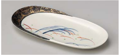
ミ140-117 秋草金タタキ突出皿 23.2×11×1.5cm (80入・磁) 1,950円