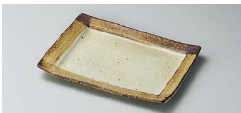
ト140-187 角測サビ焼き物皿 19.4×14×2cm (40入・磁) 1,800円