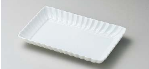
ヤ140-087 白菊21cm長角皿 21×13.3×2.8cm (40入・磁) 1,900円