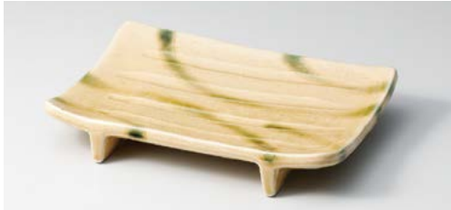
ア140-027 黄交趾焼物皿 21.6×14.8×3.9cm (20入・磁) 2,800円