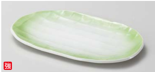
ロ140-167 ヒワ吹格子 小判焼物皿 21.3×13.5×1.6cm (40入・強) 1,560円