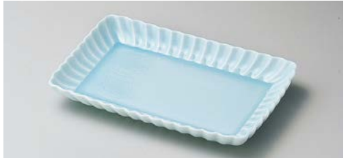
ユ140-067 かすみ青白21cm長角皿 21×13.3×2.8cm (30入・磁) 2,000円