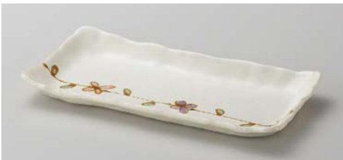
ト139-167 花結長角皿 23.5×12.2×2.4cm (40入・陶) 1,350円