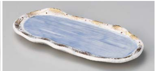
ミ139-097 湖畔焼物皿 24.2×10.8×2.5cm (60入・磁) 2,850円