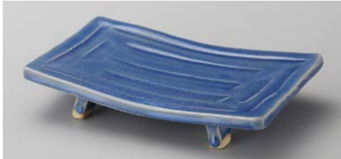
ミ139-057 青釉ソギまな板焼物皿 21.8×14.2×4.8cm (40入・陶) 3,420円