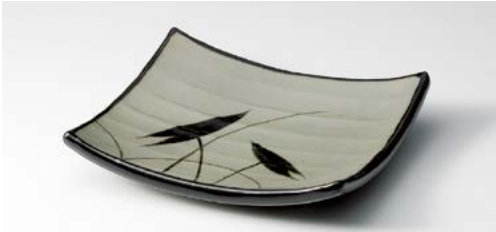
ミ139-047 益子水草足付7.5皿 18×15.8cm (50入・陶) 2,600円