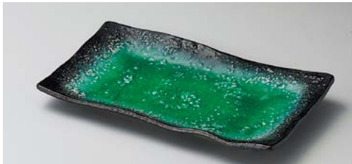
タ139-117 エメラルドグリーン華焼物皿 24.3×14×3cm (30入・陶) 1,460円