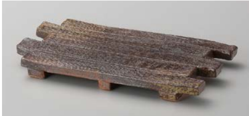
ミ139-027 備前風 イカダ焼物皿 23×12.5×2cm (40入・陶) 3,950円