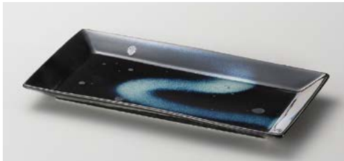
ト139-147 トワール 銀河長角皿 23.5×12.5×2cm (40入・磁) 1,250円