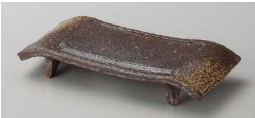
ミ139-077 手造り備前風弓型7.0長角皿 21×10.3×3.5cm (40入・陶) 2,800円