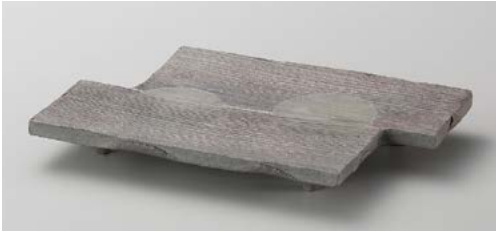
×139-017 炭化ハツ橋足付皿 24×16×2.5cm (30入・陶) (信楽焼) 8,050円