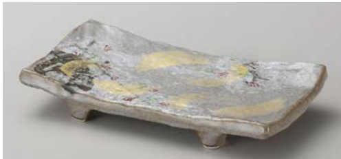
カ139-087 乾山春秋焼物皿 21×12×2.8cm (40入・陶) 3,300円