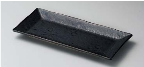
ハ139-137 黒水晶しおり長角皿 26.7×12×2.2cm (40入・磁) 1,330円