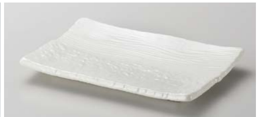
キ139-197 白楽焼物皿 21×14.5×2.6cm (40入・磁) 820円