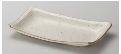
カ139-157 オルジェ折り紙焼皿大 24.8×15×3.3cm (30入・磁) 1,200円