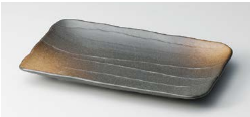
ミ139-107 備前風 8.0焼物皿 22.8×13.8×2.4cm (50入・磁) 1,320円