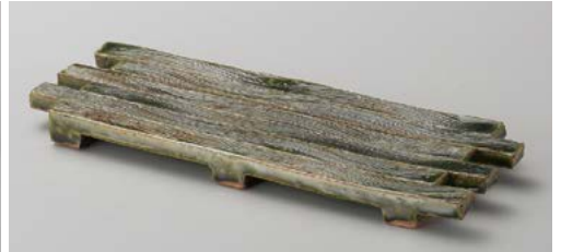
ミ139-037 オリベ イカダ長角皿 25.5×8.5×2cm (50入・陶) 3,550円