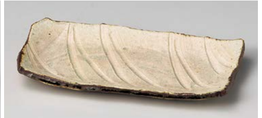
ト139-067 淡緑長角皿 26×12.5×2.5cm (30入・陶) 3,650円