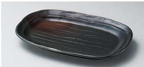
ネ139-177 黒備前楕円皿大 24.5×16.2×3cm (60入・磁) 1,050円