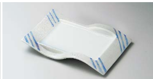
ミ136-107 ブルー線ラスター前菜皿 25.5×16.5×3.5cm (40入・磁) 3,350円