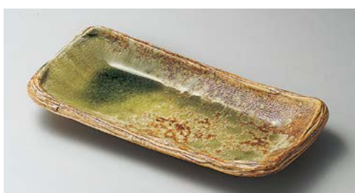
×136-087 灰釉足付長方皿 25×11.5×4cm (40入・陶) 3,480円