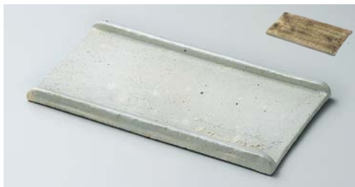
カ136-017 リバースプレート 28×14×1.8cm (40入・陶) 5,600円