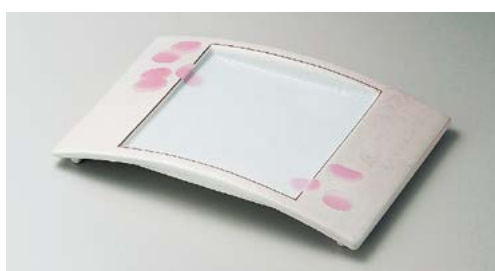
ミ136-067 ピンクラスター弓型前菜皿 25.5×16.5×3.4cm (40入・磁) 3,600円