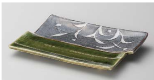
イ136-027 織部井桁焼き物皿 22×12×2cm (40入・陶) 5,300円