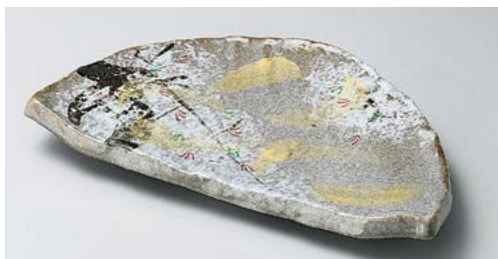
カ136-117 乾山春秋半月前菜皿 24.5×13.5cm (30入・陶) 3,350円