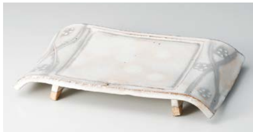
ミ136-037 手造り粉引華紋(土物)弓型8.5前菜皿 26×16×3.8cm (30入・陶) 5,100円