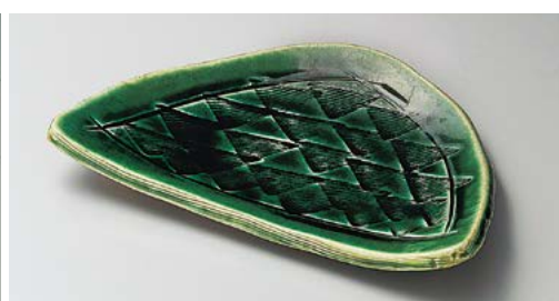
ミ136-077 織部半月三角紋盛皿 27.5×16.5×4cm (30入・陶) 3,350円