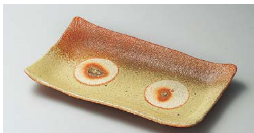
カ136-097 火色伊賀吹き焼物皿 23.1×13×2.8cm (20入・陶) 3,400円