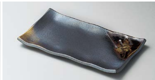
ネ136-047 いぶし金彩焼物皿 23.5×13×2.2cm (60入・陶) 3,600円