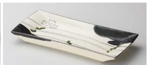
ミ128-107 黒織部 長角皿 29.2×13.5×3.2cm (40入・陶) 4,150円