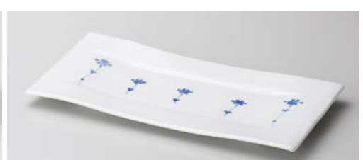
ミ128-147 染付小花長盛皿 31.3×15.2×2cm (30入・磁) 3,650円