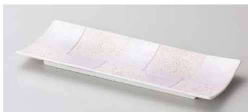
オ128-087 銀彩ピンクー珍市松花長角皿 29.7×11.3×2.5cm (48入・磁) (美濃焼) 4,250円