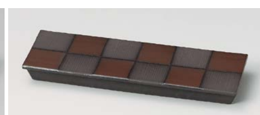
ツ128-127 炭化土鉄ラスター市松皿(中) 31×10×3cm (20入・陶) 3,650円 ツ128-137 炭化土鉄ラスター市松皿(小) 20.5×10×2.5cm (40入・陶) 2,500円