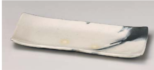
×128-157 白化粧ぼかし長角皿 31.5×12.3×2.5cm (50入・陶) 3,250円