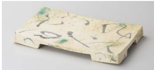
ホ128-047 雅盛皿 25.7×14.7×3cm (25入・陶) 5,700円