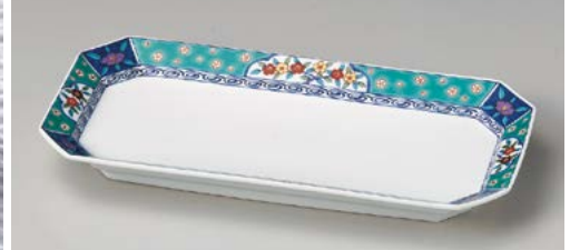
テ128-037 グリン花小紋高台細長皿 30.2×14.8×3.2cm (40入・磁) 5,800円