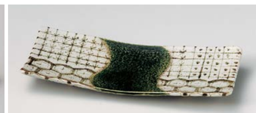
ト128-097 錆亀甲足付焼物皿 29×12×2.5cm (30入・陶) 4,400円