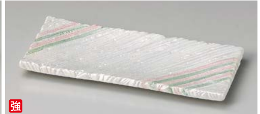
ユ128-177 二色ラスターしのぎ長角10.0皿 31.5×14×2.5cm (20入・強) 3,600円