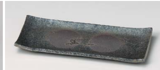
×128-057 黒窯変ボタモチ10.0長角皿 31.5×14×2.3cm (20入・陶) 5,540円