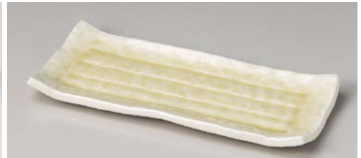
テ128-067 黄白瓷尺焼物皿 31×13cm (30入・磁) 5,500円 テ128-077 黄白瓷8.0焼物皿 23.8×10.2cm (40入・磁) 3,450円