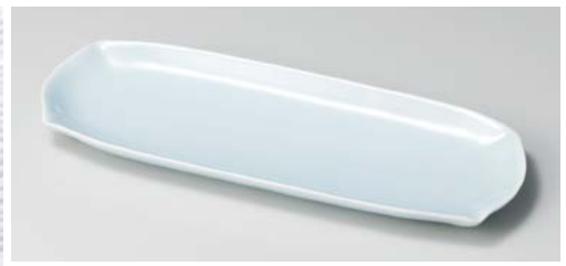
タ128-017 花笑み31cm細長皿 30.8×11.5×2.4cm (20入・磁) 2,500円 タ128-027 花笑み28.5cm細長皿 28.5×10.5×2.2cm (40入・磁) 2,100円