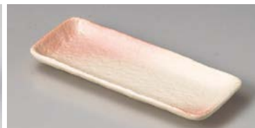
ヤ127-297 桜志野突出皿(小) 21.5×8.5×2.2cm (60入・磁) 550円