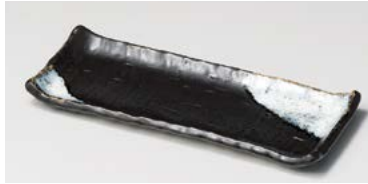
ロ127-027 融雪 付出皿 24.6×9.6×2.3cm (80入・陶) 1,080円