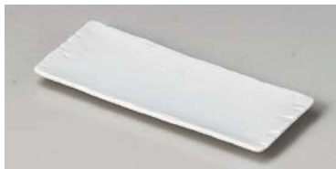
イ127-207 弥生千筋白長角皿 18.2×7.3×1.2cm (100入・磁) 850円