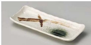
ヤ127-247 みやま突出皿 22.2×9.5×2.5cm (60入・磁) 700円