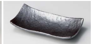
ホ127-137 赤銀彩焼物皿 20×10.5×3.5cm (60入・陶) 990円