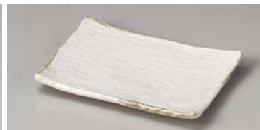
ネ127-217 くらま串皿 16.5×11.5×1.5cm (80入・磁) 800円