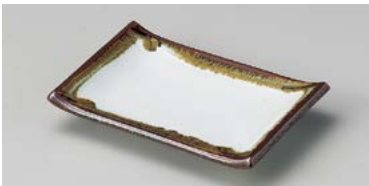
オ127-147 白天目流し仕出し皿 17.7×12.2cm (80入・磁) 980円