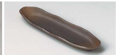
ト127-227 南蛮舟型突出皿 27.5×7.8×2.5cm (60入・磁) 820円