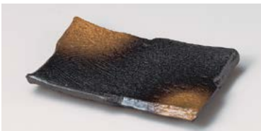
タ127-197 黒備前金茶吹玄串皿 17×11×1.9cm (60入・磁) 770円