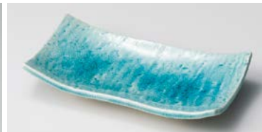
ホ127-177 トルコ長角皿 20×10.5×3.5cm (60入・陶) 990円