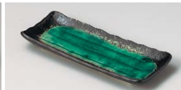
イ127-257 エメラルド突出皿 22.3×9.1×2.5cm (60入・磁) 720円