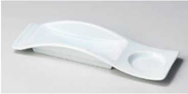
ト127-017 青磁2ピース 長角皿 25×7.6×3.6cm (50入・磁) 1,520円