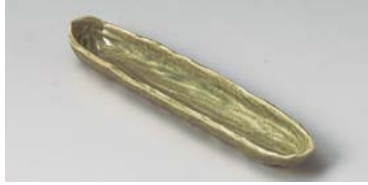
ホ127-067 灰釉前菜皿 28.5×6×3.3cm (40入・磁) 1,230円