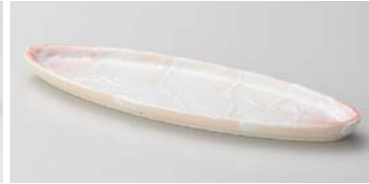
ホ127-037 桜紅志野舟型突出皿 25.8×8×1.8cm (50入・磁) 1,350円