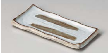
テ127-057 粉引刷毛串皿 20×9.3×1.8cm (60入・陶) 1,300円