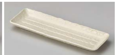
ヤ127-307 クリーム突出皿 25.6×8.5×2cm (60入・磁) 530円