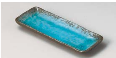
タ127-277 オーシャントルコ突出皿 21×8.2×2.3cm (60入・陶) 600円