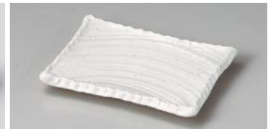
ユ127-187 雪粉引17cm角皿 17×13×2.2cm (60入・陶) 900円