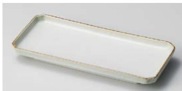
ロ127-287 葵突出皿 20.8×9.3×2.3cm (60入・磁) 800円