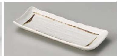
ヤ127-267 粉引ライン突出皿 22.5×9.5cm (60入・磁) 700円