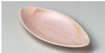
イ127-157 窯変桜花びら長皿 大 φ22×12.4cm (60入・磁) 1,200円