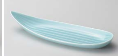
ハ127-047 笹型トレー(青磁) 27×9.2×4.5cm (60入・磁) 1,360円