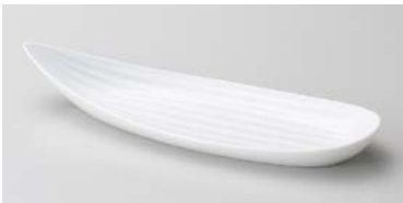
ネ127-097 白笹トレー 27×9.5×4.2cm (40入・磁) 1,250円