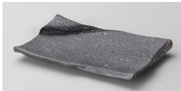
ヤ127-107 大和玄 串皿 17×11×2cm (60入・磁)(美濃焼) 1,050円