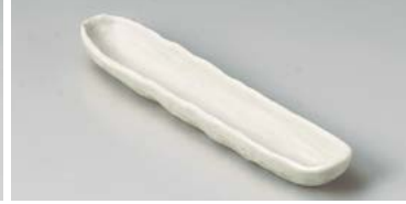
ヤ127-077 粉引前菜皿 28×6×3cm (60入・磁) 1,200円