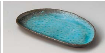
タ127-117 オーシャントルコ半月中皿 21.7×12.4×2.2cm (60入・陶) 1,000円