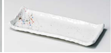
ロ127-087 はるかぜ 付出皿 24.7×10×2.2cm (80入・陶) 1,080円