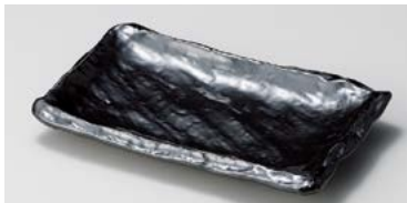
イ125-157 鉄結晶匠焼物皿 22.4×13.5×2.8cm(40入・磁) 1,540円