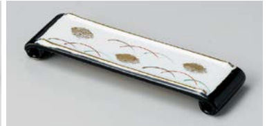
ミ125-047 手巻天目吉野前菜皿 22×6.5×2.2cm(60入・磁) 3,800円