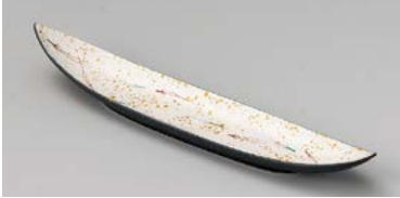
ネ125-057 強化ラスター舟型9.0寸前菜皿 27×5×3.6cm(80入・磁) 3,200円