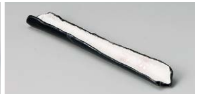
ミ125-177 ピンクラスターひねり前菜皿 31×4.3×2.7cm(60入・磁) 2,450円