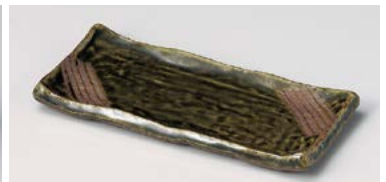
テ125-257 かいらぎ串皿 20×9.3×1.8cm(50入・陶) 1,850円