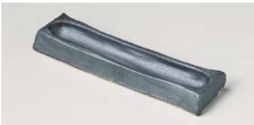
ミ125-137 鉄釉手切り彫前菜皿 約24×約5.5×約2.8cm(60入・陶) 2,400円