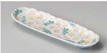
ミ125-097 花絵突出皿 24×7.8cm(60入・磁) 3,080円