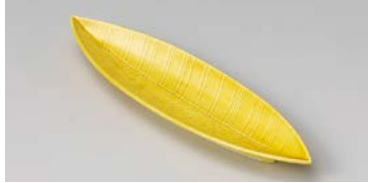
ミ125-067 琥珀笹型前菜皿 30.3×8×2.5cm(60入・磁) 3,500円