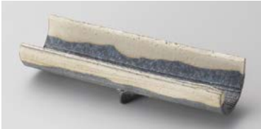
×125-017 黒窯変掛け分け6.7足付長皿 20×6.5×3.8cm(70入・陶)(信楽焼) 4,800円