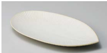
ト125-277 金砂 萌 21cm長皿 21.3×11.2×2cm(80入・磁) 790円