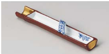
ミ125-117 朱巻竹型前菜皿 23×4.2×3.8cm(60入・磁) 2,800円