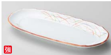
ウ125-147 錦武蔵野小判皿 23×11.9×2.3cm(40入・強)(美濃焼) 2,550円