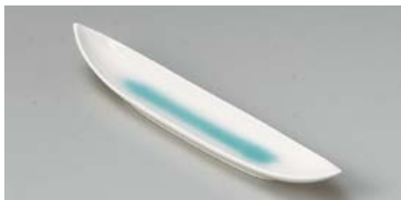
ネ125-207 青白磁舟型9.0寸前菜皿 27×5×3.6cm(80入・磁) 2,050円