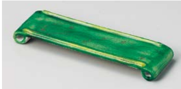
ミ125-037 金緑彩手巻前菜皿 22×6.5×2.5cm(60入・磁) 4,100円