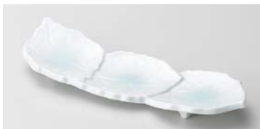
キ125-297 青白磁三枚葉皿 23.7×7.8×3.2cm(40入・磁) 1,500円