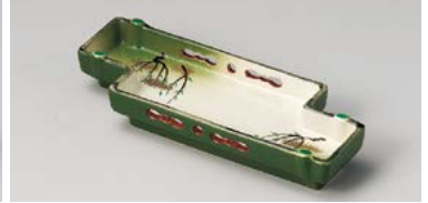
ミ125-087 京橋8.0前菜皿 24.3×9×3.5cm(30入・磁) 3,400円