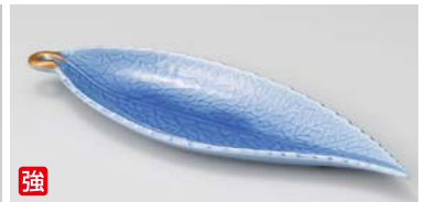
ウ125-127 コバルト木の葉皿 φ22.8×7.2×2.6cm(80入・強) 1,850円