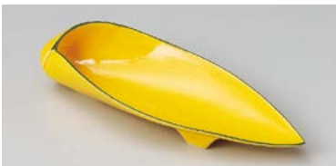
ミ125-187 瀏グリン黄釉笹形前菜皿 24×9.5×5cm(60入・磁) 2,350円