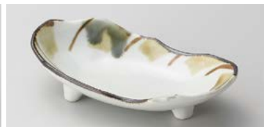
オ125-307 モダン十草三つ足中皿 18×9.4×4.8cm(80入・磁)(美濃焼) 1,500円