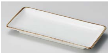
イ125-247 茶瀏波瀏付出皿 20.3×9×2.3cm(80入・磁) 980円