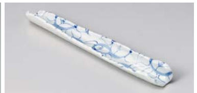
ミ125-217 染付椿絵ひねり前菜皿 31×4.3×2.7cm(60入・磁) 2,200円