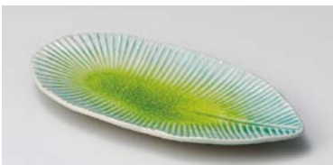
イ125-267 菜花葉形楕円皿 小 21.4×10.6×2.5cm(80入・磁) 900円