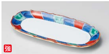
ウ125-107 紫三色小判皿 φ22.8×10.4×2.2cm(60入・強)(イングレ) 2,140円