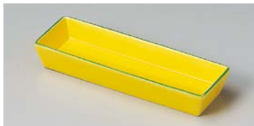
ミ125-197 黄釉瀏グリン長角70前菜皿 21.6×7×3.5cm(60入・磁) 2,280円