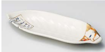
ウ125-027 百人一首仁清風葉型皿 φ25×9.2×2.7cm(60入) 2,430円