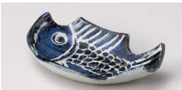
タ125-227 魚長皿 20×11.5×4.7cm(30入・磁) 2,200円