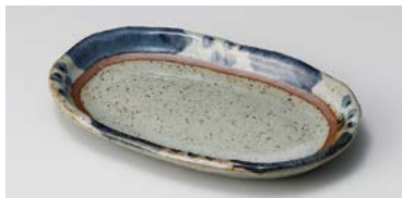
ミ125-237 はんてん格子 6.5小判皿 19.7×12.7×2.5cm(50入・陶) 1,080円