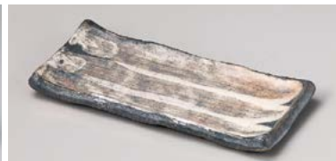
テ124-217 グレー粉引刷毛串皿 20×9.3×1.8cm (50入・陶) 1,850円