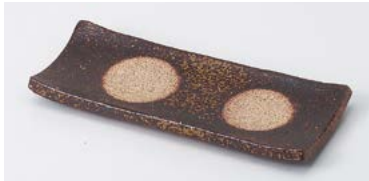
ミ124-097 備前風長角前菜皿 19×7.9cm (60入・陶) 2,400円