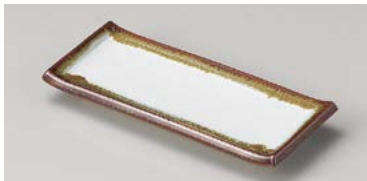
オ124-287 白天目流し突出皿 23×9.8cm (40入・磁) 1,250円