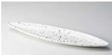
7124-187 白斑点リーフディッシュ38cm 大 38.4×8.5×2.4cm (40入・陶) 1,550円 7124-197 白斑点リーフディッシュ32cm 中 32.3×7.8×2.2cm (60入・陶) 1,150円 7124-207 白斑点リーフディッシュ26cm 小 26.3×7.2cm (80入・陶) 950円