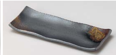
ネ124-047 いぶし金彩突出皿 21.5×8.8×1.8cm (80入・陶) 2,900円