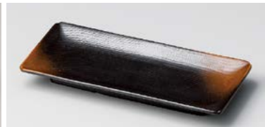
イ124-297 やきしめ波瀾付突出皿 20.3×9×2.3cm (80入・磁) 980円