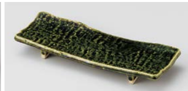
ト124-087 織部まな板突出皿 24.7×8.5×3.5cm (40入・陶) 2,550円