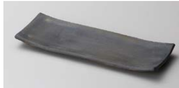
×124-107 炭化足付長皿 25.5×9.5×2.3cm (60入・陶) (信楽焼) 2,360円