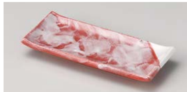
ヤ124-277 赤楽突出皿 22.8×10×2.7cm (60入・磁) 1,200円