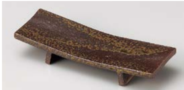
ミ124-037 備前風まな板前菜皿 22.5×7.8×4.2cm (40入・陶) 2,720円