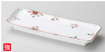
強 ト124-077 万暦手描き 長角突出し皿 22.7×8.5×2.5cm (50入・強) 2,800円