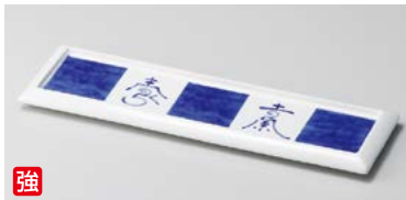
強 ウ124-057 染付市松文字リム付長皿 φ25×17.5×2.2cm (60入・強) (イングレ) 1,900円