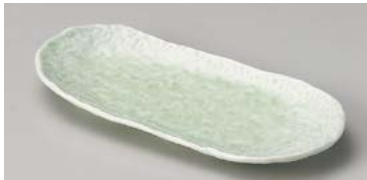
タ124-247 もえぎ岩清水突出皿 24.2×11×2.5cm (40入・磁) 1,600円