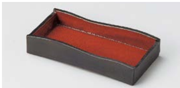
カ124-017 ジャパネスク長角突出皿小 19.8×9.2×2.8cm (30入・陶) 3,500円