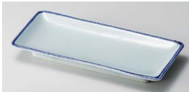
イ124-227 おふけ波瀾付突出皿 20.3×9×2.3cm (80入・磁) 980円