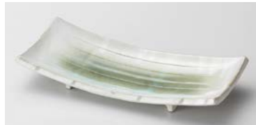
ロ124-237 新緑反突出皿 22×9.7cm (80入・磁) 1,540円