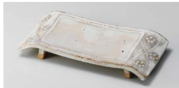
ミ124-067 手造り粉引華紋(土物)弓型7.0長角皿 20.5×10.5×3cm (30入・陶) 2,780円