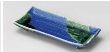
ミ124-027 深海オリベ手造り突出皿 21.5×9.7×3cm (50入・陶) 3,450円