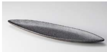
7124-157 紫ペーパリーフディッシュ38cm 大 38.4×8.5×2.4cm (40入・陶) 1,550円 7124-167 紫ペーパリーフディッシュ32cm 中 32.3×7.8×2.2cm (60入・陶) 1,150円 7124-177 紫ペーパリーフディッシュ26cm 小 26.3×7.2cm (80入・陶) 950円