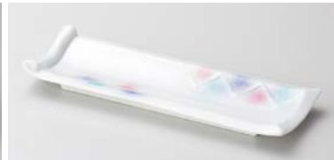
ミ124-257 淡雪三色吹 突出皿 25.5×9×3cm (50入・磁) 1,550円