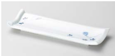
ミ124-267 染付花絵 突出皿 25.5×9×3cm (50入・磁) 1,400円