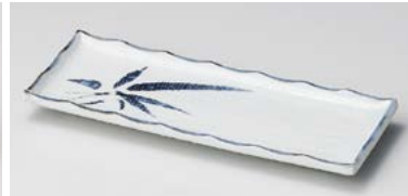
ヤ124-127 古染布目笹9.0突出皿 24.5×9.3cm (60入・磁) 1,100円